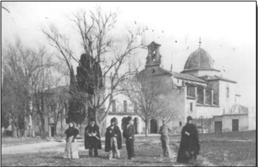
Personatges vora el santuari del Lledó (c. 1900)