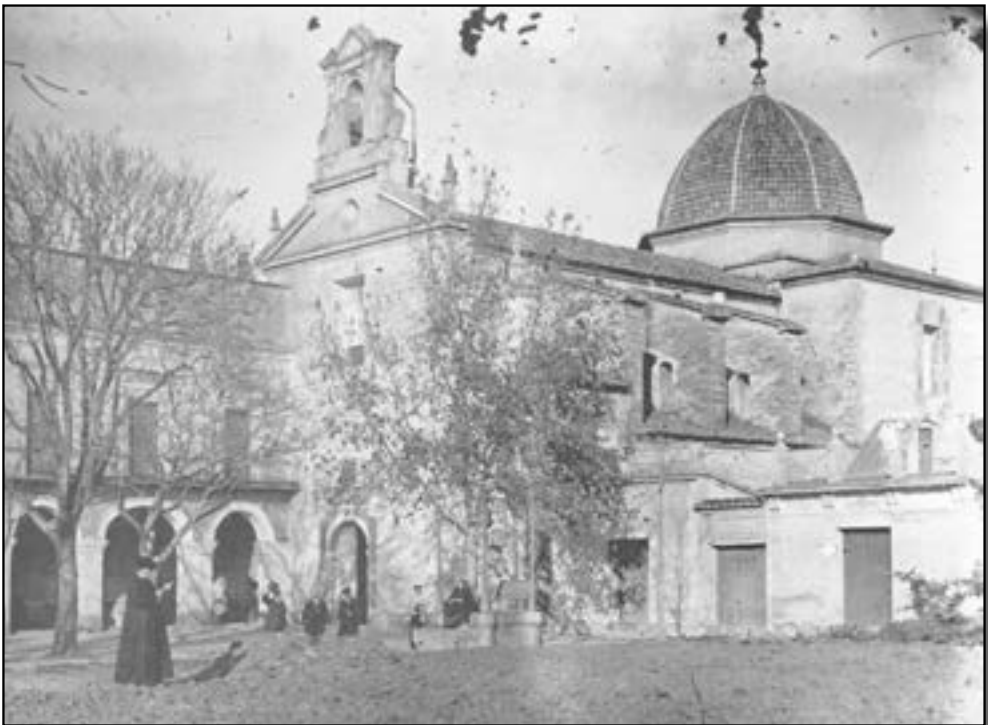
Personatges vora el santuari del Lledó, a finals del segle XIX. Original: Placa de vidre de 13 x 18 cm.