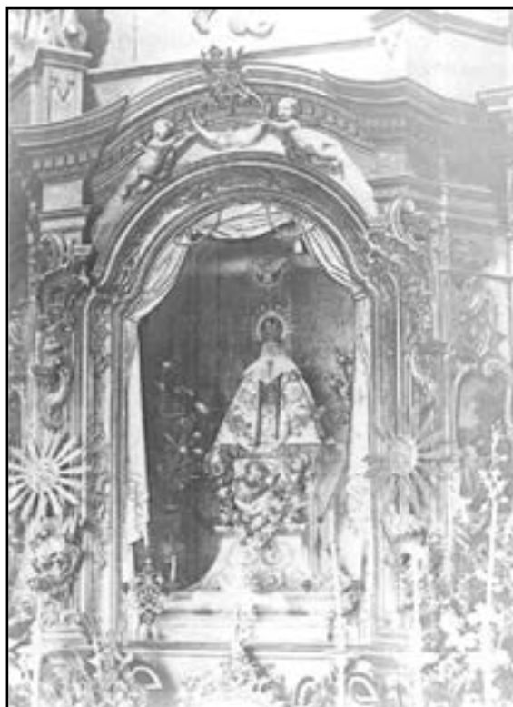
Retaule del cambril del santuari de la Mare de Déu del Lledó, tal com era a principis del segle XIX