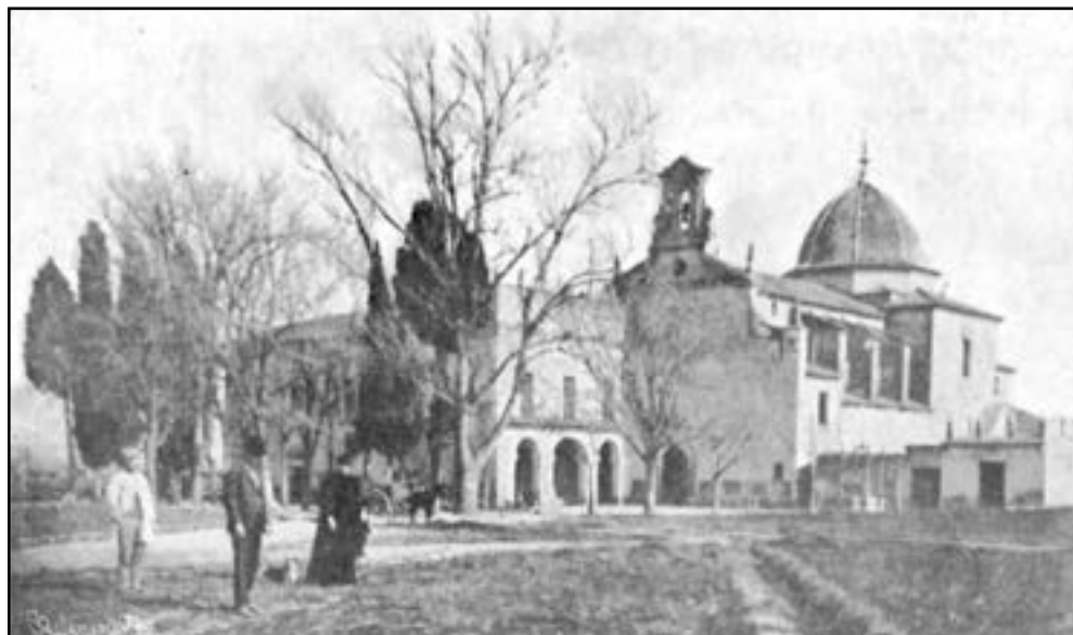
Vista panoràmica més antiga coneguda del santuari del Lledó