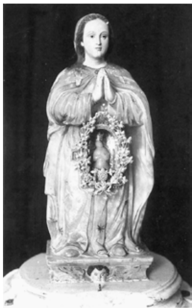
Imatge reliquiari de la Patrona de Castelló