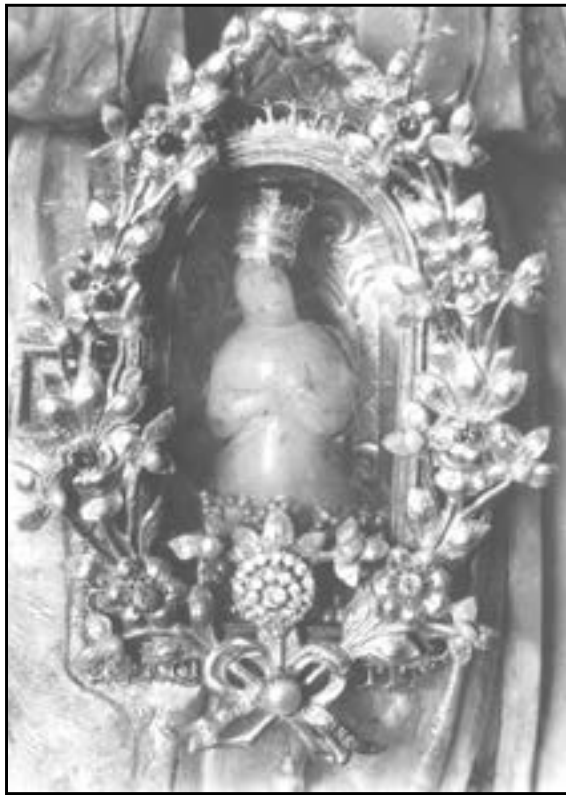
Imatge de la Troballa. Foto de finals del segle XIX