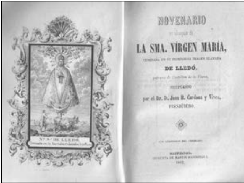
Interior de la primera edició del Novenario . (1862), obra de Cardona Vives

Resulta de gran interés que, en una obra escrita en castellà, s'utilitze la forma genuïna «de Lledó», i això és molt important per a demostrar encara més la perduració al llarg del temps del nom correcte de la Patrona de Castelló, també en el segle XIX. És també digne de remarcar que la perduració de la forma «de Lledó» estiga vinculada a la personalitat de Cardona Vives, figura destacada de la societat castellanenca del vuit-cents.