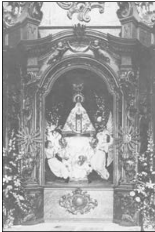
Imatge del retaule del santuari del Lledó al finals del segle XIX