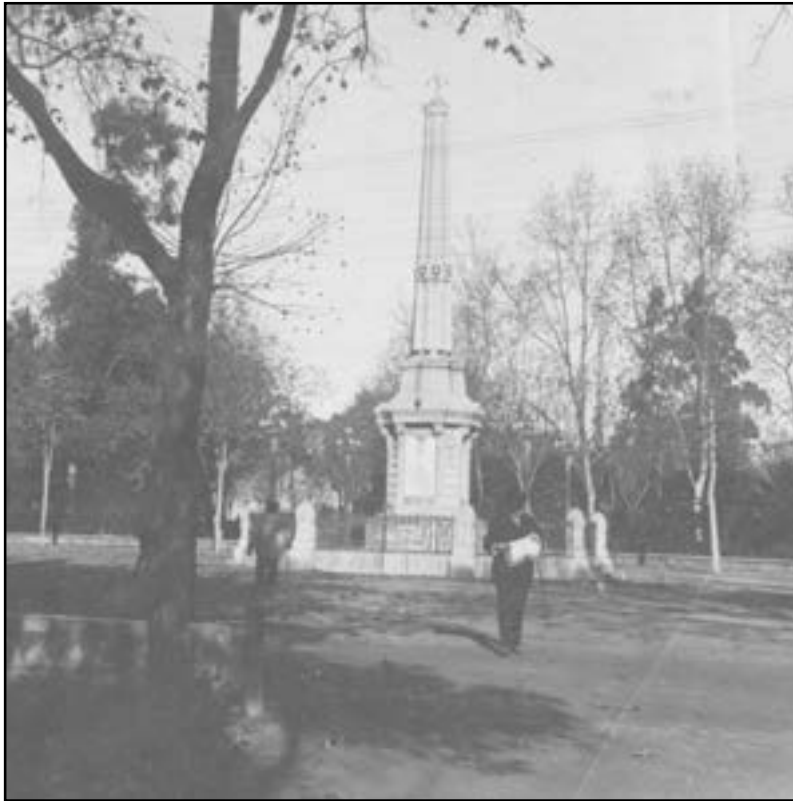
Obelisc a la llibertat, en memòria dels fets de 1837. Obra de l'arquitecte Francesc Tomàs Traver

La Virgen del Lidón dice que no quiere ser carlista, que quiere ser capitana de la liberal milicia.