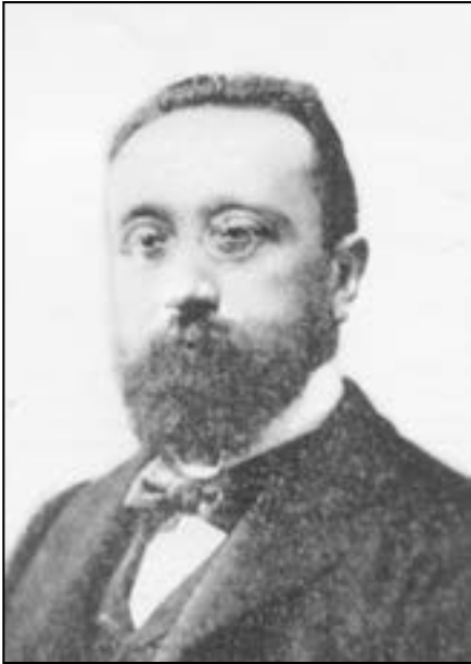
Fernando Gasset, líder dels republicans castellonencs del segle xx

Els sectors del catolicisme polític de la capital van resoldre de competir amb la candidatura de Fusión Republicana , en les eleccions municipals parcials del 9 de maig de 1897. Es va formar una col·lecció formada per carlistes, integristes i el partit conservador, és a dir el Cossi . En una ciutat com Castelló, amb el vot cada vegada més polaritzat entre els republicans i el conservadorisme catòlic, el partit conservador –malgrat el seu liberalisme– intentava aconseguir el suport de les masses catòliques. El resultat d'aquesta renovació de dos terços de l'Ajuntament va ser significatiu: el triomf