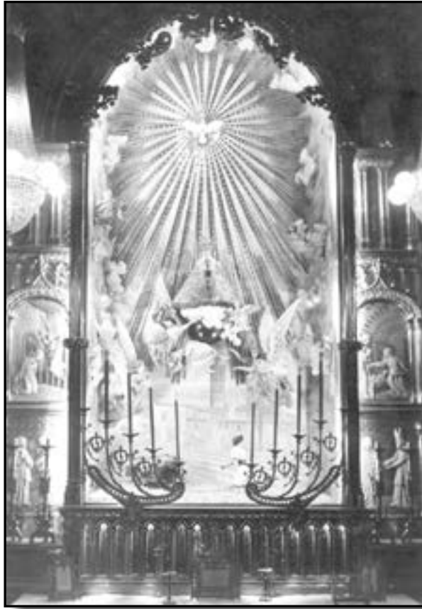
Altar de la patrona en l'església de Santa Maria, el 1870. decorat pel pintor Vicent Castell el 1922.

perquè, com que es tracta d'una propietat del poble de Castelló, «tiene los de la población entera». Amb motiu d'epidèmies, sequeres o guerres, l'Ajuntament, responent a un sentiment de la col·lectivitat, ha pres la iniciativa de traslladar la imatge a l'església Major de Santa Maria. Es posa l'exemple de la celebració de 1876, per l'acabament de la guerra carlina, i es recorda que les festes extraordinàries del 500 aniversari de la llegendària troballa, el 1866, pagades pel municipi, són una prova evident que el patronat de l'Ajuntament sobre la Mare de Déu del Lledó està «tan ferviente como lo fue en su origen».