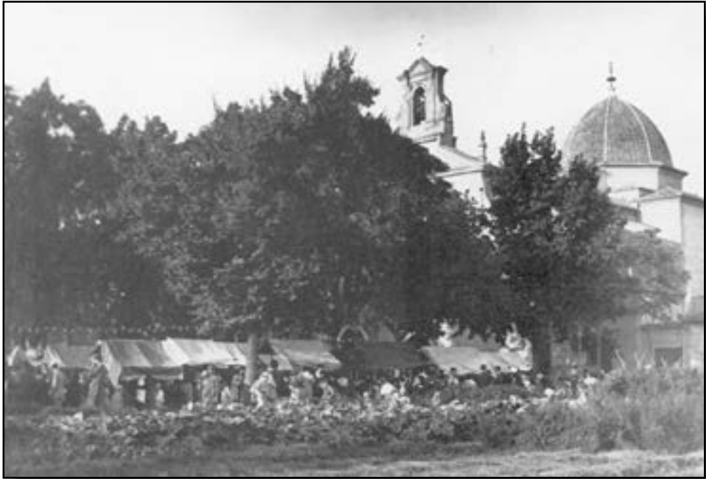
Anònim: "Porrat" de la festa al santuari del Lledó, al setembre de 1909

febrer de 1884 l'onzé aniversari de la Primera República va buscar el lloc de Lledó com a marc de trobada. El grup de seguidors republicans, sembla que format per set persones, es va dirigir fins al santuari de Lledó, on pensaven celebrar en la casa prioral un dinar commemoratiu, juntament amb el clavari, a qui el periòdic afí als esmentats zorrillistes presentava com a «afecto al partido republicano».