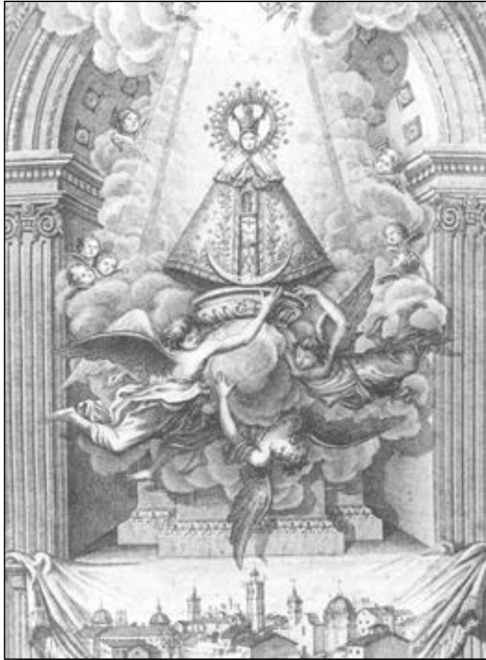
Gravat de la Mare de Déu del Lledó. Obra de Facundo Larrosa i Juan Bautista Carbó. 1866.

del novenari, cavalcades, vols de campanes, solemnes processons, castells de focs, danses, serenates, una funció teatral, ornamentacions públiques i una correguda de jònecs (Soler, 1966).