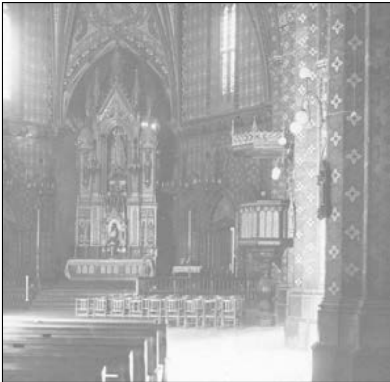
Interior de l'església de Santa Maria, de Castelló. «El turismo práctico». Editorial Alberto Martín. Barcelona. 1910