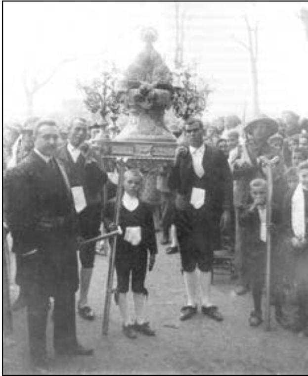
Processó en acció de gràcies per la pau europea (1919) pel camí Lledó

un xicot del grup avalotador, però la lluita desencadenada va acabar amb el guàrdia per terra.