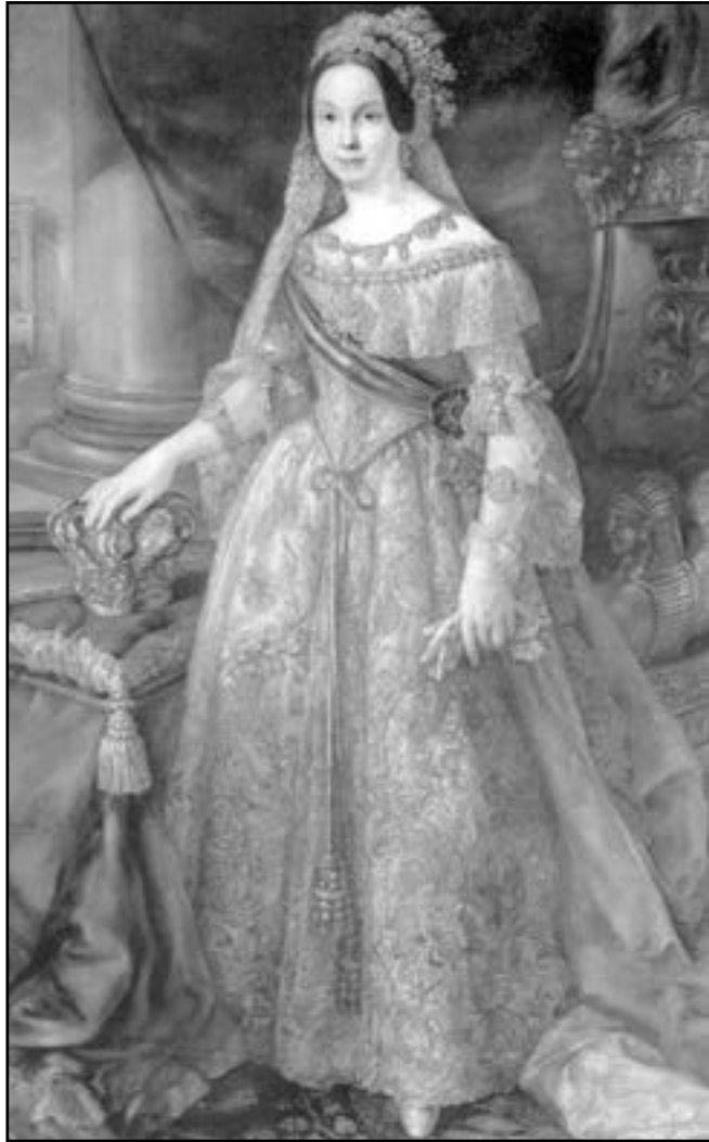
Reina Isabell II

dins l'apartat de despeses municipals, en la secció de «pensiones de censos» es consignen 677 reals per a les capellanies i 207'26 per al santuari del Lledó, les mateixes quantitats consignades durant tota aquesta època de col·lisions polítiques. En l'any anterior, 1842, també consta la dotació del mateix import que anys anteriors per a «la administració de Nuestra Sta Ymagen».