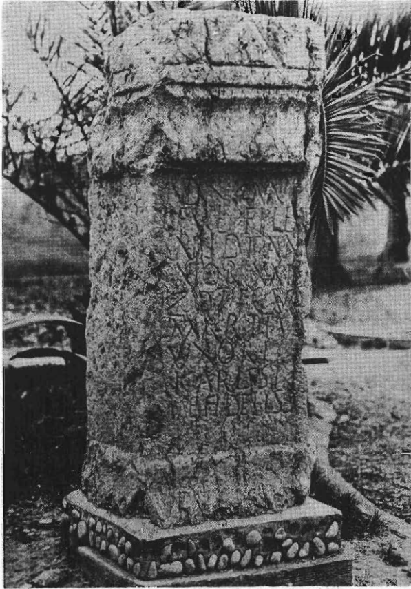
Inscripción núm. 117