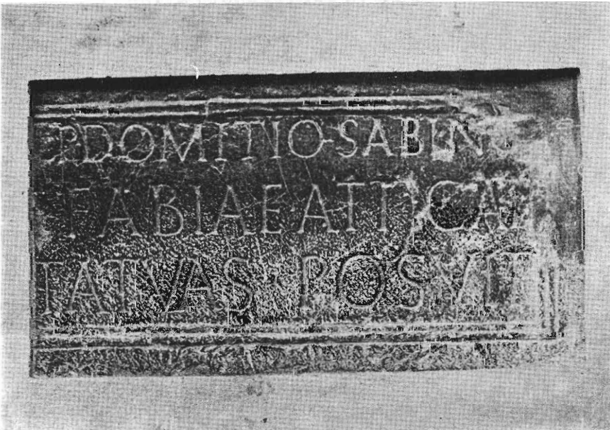
Inscripción núm. 131.