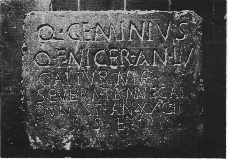
Inscripción núm. 44 (F. Autor)