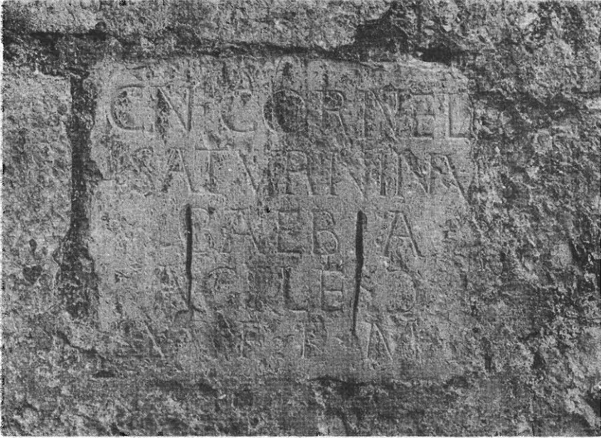
Inscripción núm. 12.