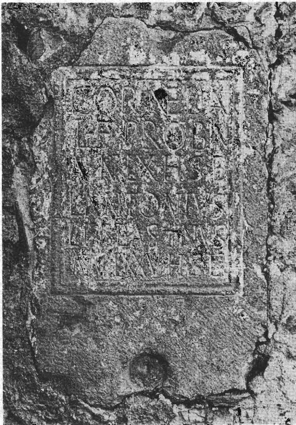
Inscripción núm. 38 (F. Autor)