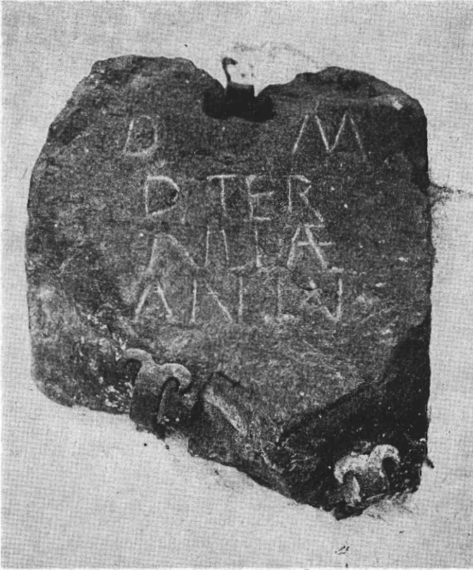
Inscripción núm. 81 (F. Autor).