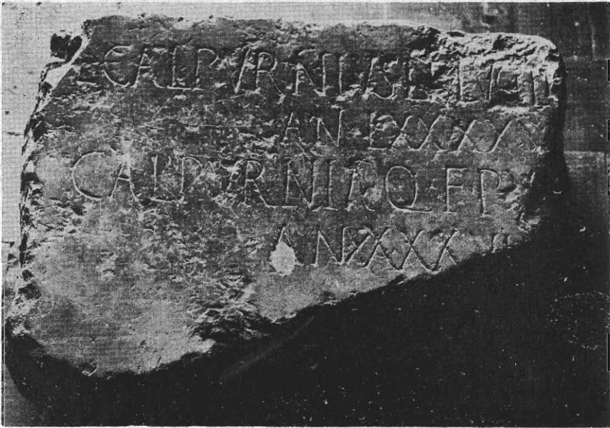
Inscripción núm. 93 (F. Autor).