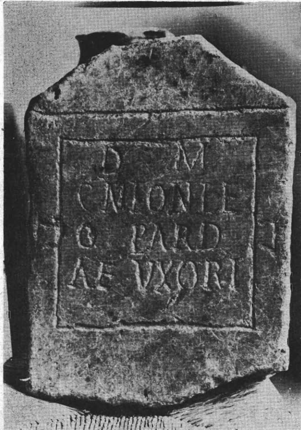
Inscripción núm. 103.