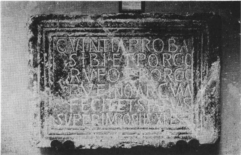
Inscripción núm. 82 (F. Autor).