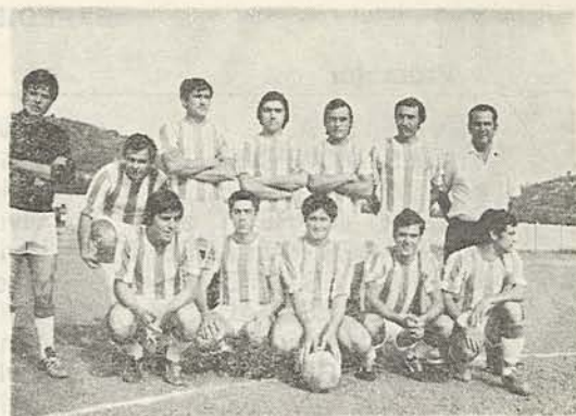
Equipo temporada 1976