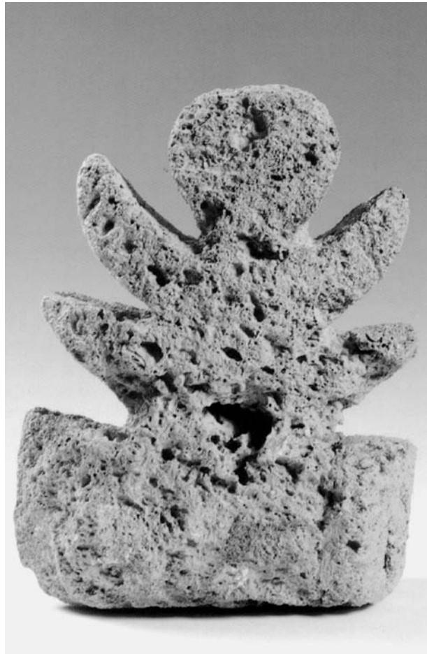
Figura 3. Ídol eneolític d'Artana.

A grans trets podem resumir el procés metal·lúrgic del coure de la següent manera: recollida del mineral a les mines a l'aire lliure o a l'interior de la terra mitjançant pous i perforacions; triturat, mòlta o polvorització del mineral en morters o molins, per a seguidament calfar-lo a fi d'obtenir partícules foses per a ser rentades; novament es comença el procés de calentament o de torrefacció als forns, a una temperatura mínima de 815 graus centígrads amb la fi d'obtenir el metall a partir del mineral, i com a resultes de tot això, s'obtenia l'escòria, la qual es trencava per així obtenir petites boletes de coure. Tot seguit s'aplicava un nou procés de fosa, també en forns, amb les boletes de metall cuprífer, aquesta vegada a una temperatura de 1085 graus centígrads, a fi d'aconseguir el líquid metàl·lic, que s'abocava a l'interior dels gresols d'argila; seguidament venia el vessat del metall líquid als motlles amb les formes dels instruments desitjats; seguia un procés de refredament i enduriment del metall a l'interior del motlle, aconseguint-se un pa de mineral fos o lingot per a la seva posterior fosa, o àdhuc les peces obtingudes directament dels motlles. Una vegada fabricada la peça es