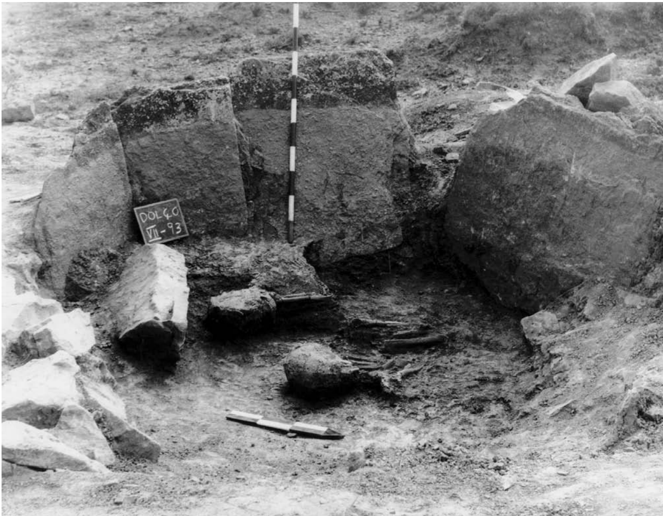
Figura 4. Cista d'enterrament del neolític final, apareguda al terme de Morella (foto N. Mesado).

Els caçadors residuals d'arrels mesolítiques que encara perviurien a les zones muntanyenques de l'interior al llarg del V i IV mil·leni, representant escenes de caceres naturalistes, i àdhuc en certs casos pintant en linial-geomètric; les poblacions neo-eneolítiques no agrícoles que caçaven i pastorejaven, i que per influències del substrat meso-neolític, també seguien pintant amb l'estil naturalista i seminaturalista; i les poblacions neolítiques amb agricultura i ramaderia que a certes zones d'Alacant utilitzaven l'estil macrosquemàtic, durant el V i IV mil·leni. A la primera meitat del III mil·leni encara l'estil llevantí perduraria, apareixent a partir de la segona meitat del III, certs motius de l'art esquemàtic, el qual continuaria, canviant temes i estils fins al primer mil·leni. Complicat panorama el que presentem ací, i que molts investigadors no acceptarien en absolut. Però nosaltres no creiem en sistematitzacions tancades ni en concepcions unívoques,