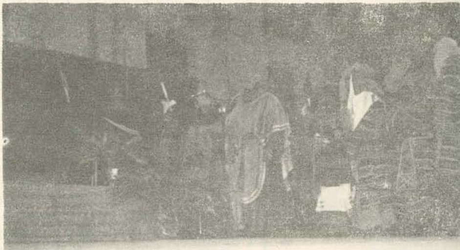
El Sanhedrín ante Pilato

... Y llegó el momento culminante de la Pasión. Nueva Jerusalén llegaba a su cenit: el Gólgota, nuestro Calvario. El camino, tortuoso y difícil, era ahora llano y suave. Las zarzas espinosas parecían rosas fragantes y perfumadas. La gente corría por los senderos sin reparar en obstáculos. A mitad del camino aparecía de pronto la imagen dantesca de un Judas, balanceándose en el vacío. Allí arriba, en la cima del montículo, la angustia del drama. Sobre el cielo límpido y cubierto de blancas estrellas, la luna dejaba ver tres figuras extrañas luchando contra la muerte. En el centro, Jesús de Nazareth, Aquél que poco antes desfilaba por nuestras calles. Una voz profunda y agitada desgarraba el silencio de la noche: «¡Eli, Eli, lama sabachthani!» El eco de las montañas repetía y repetía las mismas palabras. Poco después, un postrer