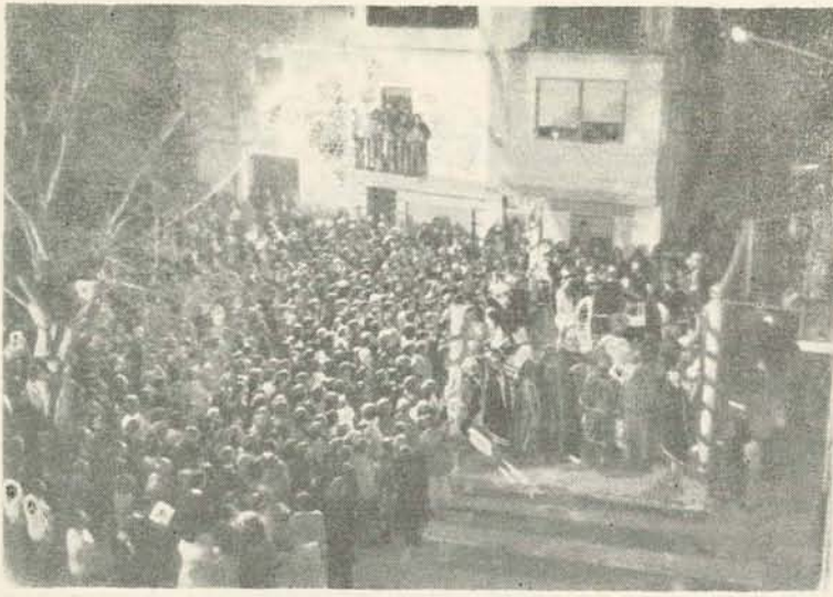
La multitud en el juicio de Herodes