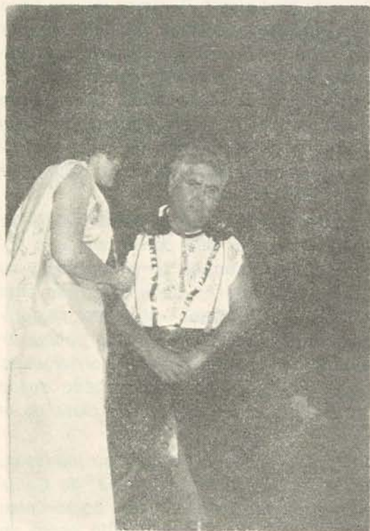
Temores de Pilato