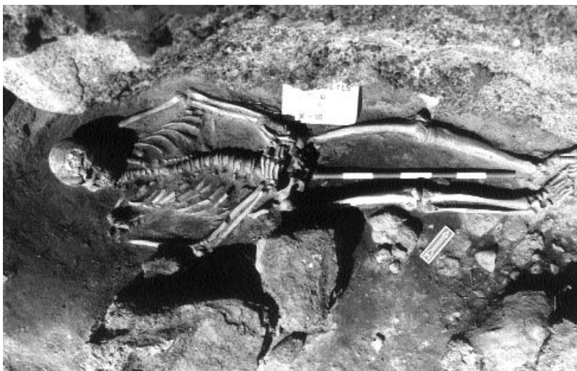
2. Detalle en planta de la disposición del esqueleto mirando al oeste.