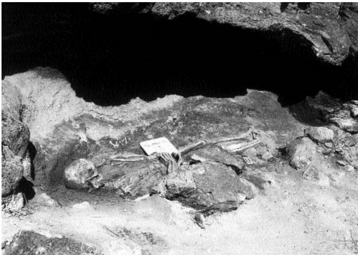
1. Vista general del covacho y de la disposición de piedras para el cerramiento.