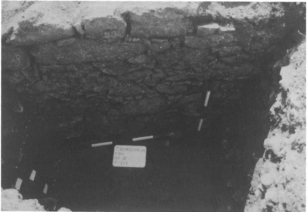
Fig. 2. Detalle de la cara exterior de la muralla.