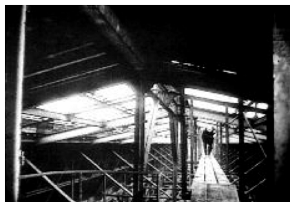
Decorado de la estación de Orsay