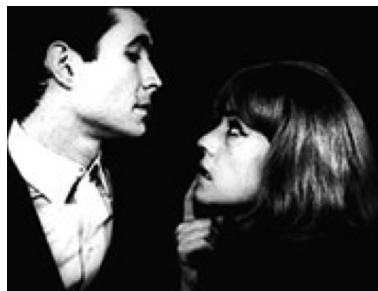
K. y su vecina