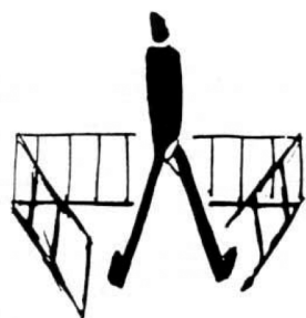
Dibujo hecho por Kafka

Finalmente, la realidad y la pesadilla son intercambiables, hasta el punto de que para muchos lectores y espectadores, la historia narrada sería un mal sueño de Josef K. Mostrar el angustiioso mundo onírico con la misma precisión y distanciamiento que en un reportaje, es quizás el mayor logro de la deslumbrante adaptación de Welles.