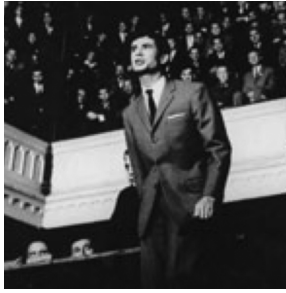
K se defiende en su interrogatorio