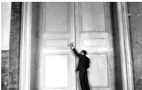
K ante la puerta de la ley