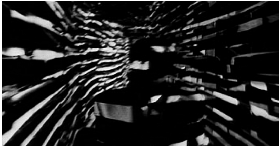
Pesadilla visual al visitar al pintor