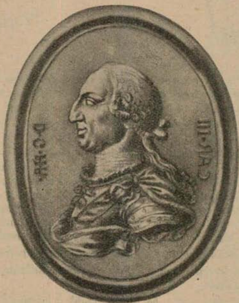
Medallón, en bronce, del retrato de Carlos III (Copia al carbón por el joven Vicente Lloréns)

Príncipe tan deseado no se puede explicar, así como tampoco el tierno afecto, devoción y sentimiento de gratitud de sus corazones a San Pascual por tan inestimable beneficio, aumentándose a éste con nacimientos de otros seis varones, reconociéndolos a todos por hijos de las oraciones de San Pascual.