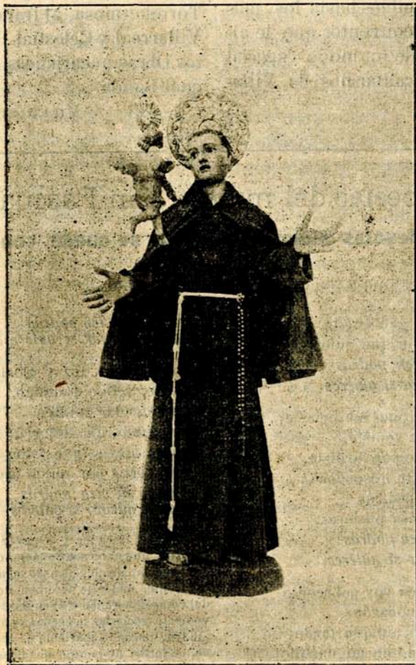
Imagen que se venera en la iglesia de S. José de Elche, donde tomó el hábito el Santo

(2) Parecería más propio decir dejes que sueltas: pero no evocaría tan al vivo la imagen de la lucha que San Pascual recuerda en la estrofa.