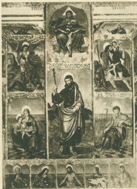
Retablo de la ermita de San Jaime

Un paseo por la huerta pródiga y bella puede hermanarse con la visita a las ermitas de San José, San Isidro, San Roque de Canet y Fadrell, lugares de devoción, algunos con reliquias medievales. La ermita de San Jaime, antigua iglesia de la Encomienda de Fadrell, de la Orden de Calatrava primero y de Santiago después, conserva una pila bautismal románica, un re-