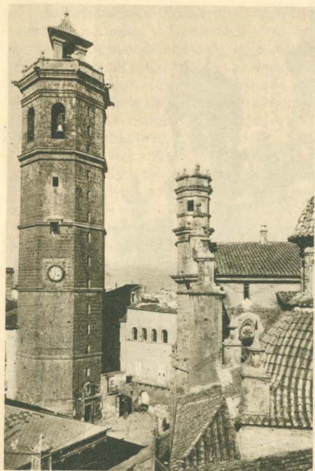
Torre de las campanas e iglesia de Santa María

del pasado siglo, mereciendo por su heroica defensa contra las tropas de Cabrera en 1837, los títulos de Fiel y Leal, y alcanzando el de Constante y el tratamiento de Excelencia por los méritos contraídos en defensa de la libertad durante la segunda guerra carlista.