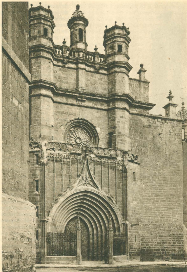
Fachada de Santa María