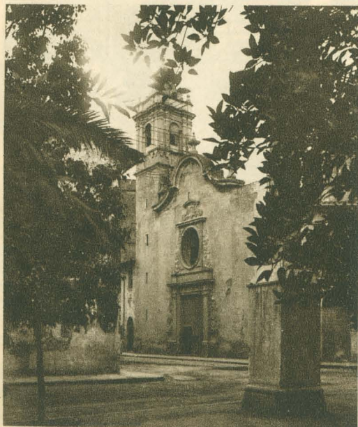
Iglesia de la Sangre

La Magdalena , al NE. de la ciudad, a unos 7 kilómetros, es una rústica y evocadora ermita sobre un tormo que fué castro ibérico y donde todavía quedan vestigios árabes y medievales; ofrece exuberantes y amplias perspectivas ricas de color y llenas de emoción. Emplazóse aquí el primitivo Castellón. La ermita solo se abre el día de la