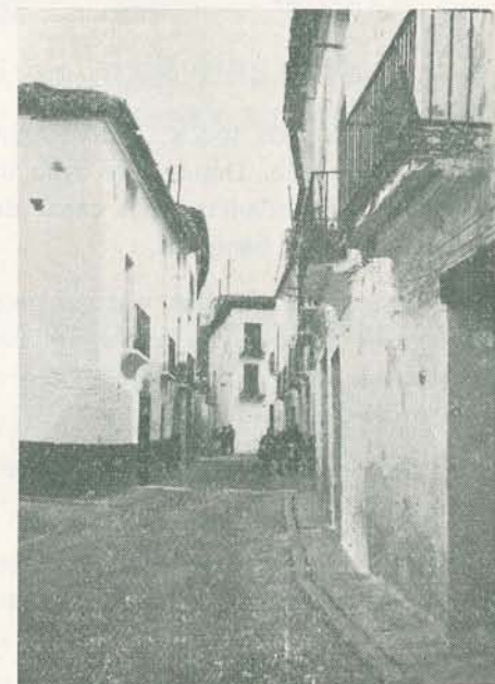
Alcublas.— Calle Mayor.

Rozaduras, escaldaduras, erosiones, use siempre polvos de talco