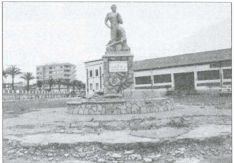
Si vols veure la teua Foto-denúncia publicada, envia-la a La Veu de Benicarló c/ Sant Francesc, 95 Benicarló