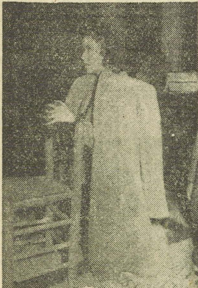
Nuestra Fallera Mayor, orando ante la imagen de la Virgen de los Desamparados.

—Mi deseo, como reina de la fiesta, es el de resultar tan agradable a Valencia y sus falleros como yo íntimamente quiero. En verdad nada puedo pedir, después del espléndido acto de mi proclamación oficial; sólo eso, es más de lo que puede pedir una reina