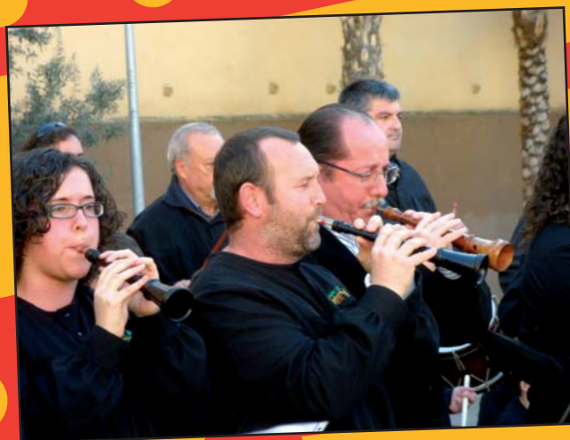
Moment de la Trobada 2011