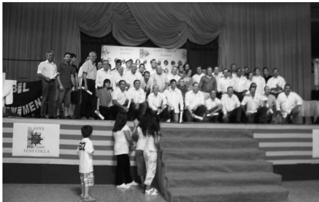
La Pèrgola, Xaloc al complet en la festa del X Aniversari de la colla

E n la Colla Xaloc hem arribat al butlletí nº 50, publicació que, a més de mostrar en la nostra pàgina web ( www.collaxaloc.com ), remetem periòdicament per correu electrònic a qualsevol persona que ho sol·licite, especialment aquelles entorn del món de la festa.