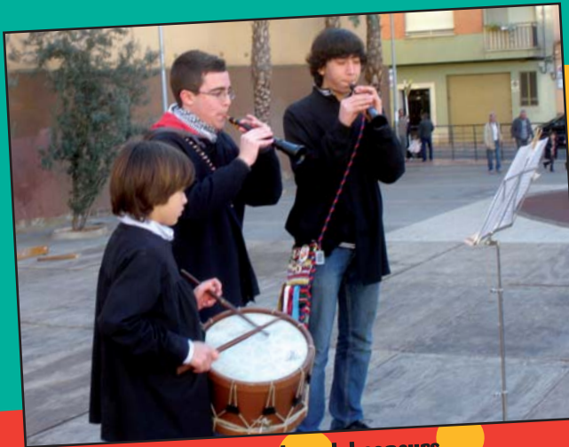
Els guanyadors del concurs