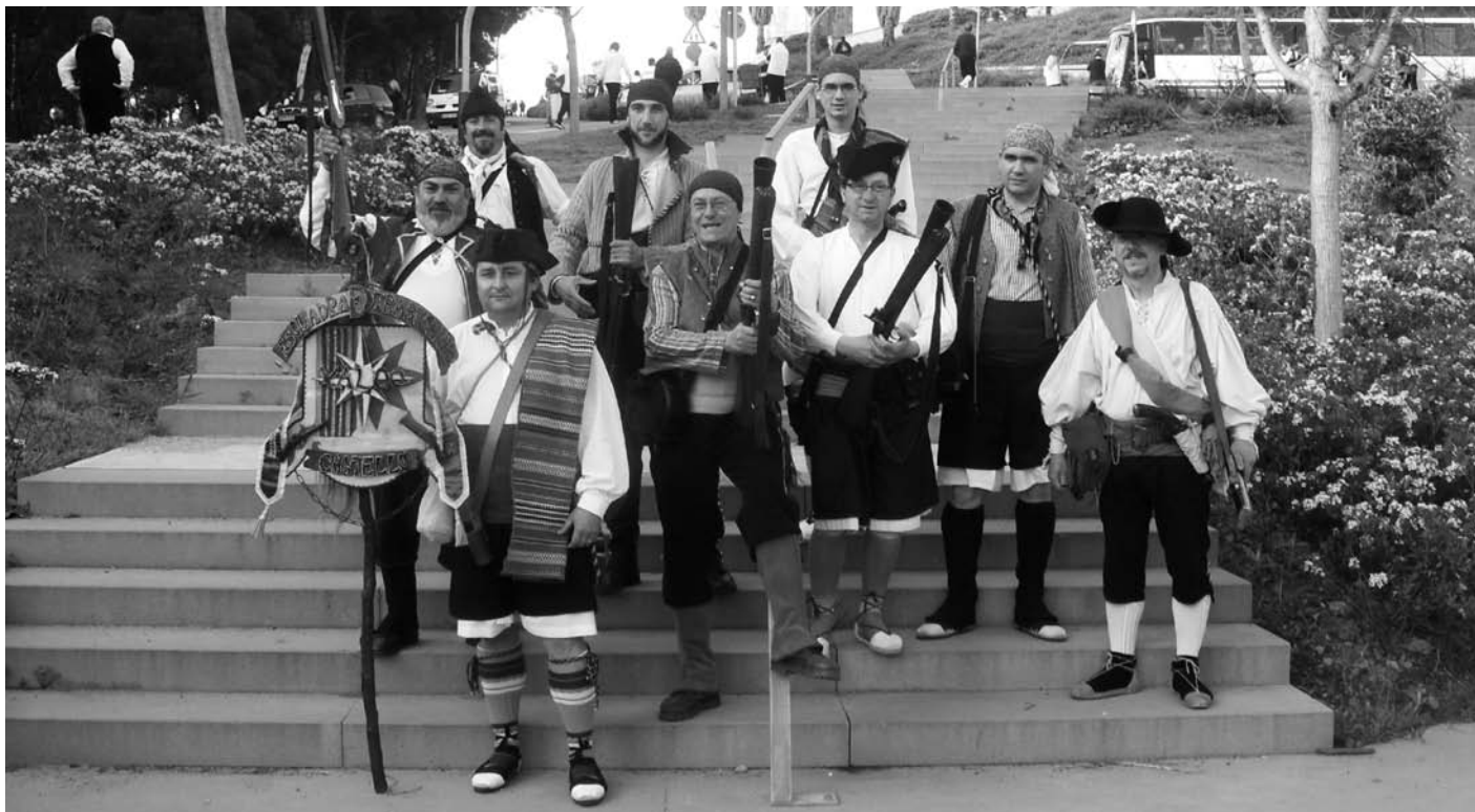
Esquadra de Trabucaires Xaloc en una actuació a Barcelona

segle XIX, guerrillers castellanencs en la guerra de la Independència 1808-1814), així com normativa en vigor sobre armes de sisena categoria i l'ús i seguretat amb la pólvora especial que empren per a les salves; referent a açò, nosaltres mateixos confeccionem els monogràfics dels curssets amb tècniques per als nous trabucaires, sent hui dia un referent de rigor entre aquest tipus d'associacions.