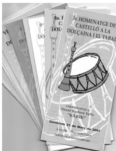
Tríplics Homenatge de la Ciutat de Castelló a la dolçaina i el tabal

Cal dir també que mostrem temes sobre el món dels trabucaires o arcabuseria de festa: Monogràfics sobre indumentària i equip dels trabucaires que representem, amb l'objectiu d'adaptar-se el més fidelment possible a l'època que representem (començaments del