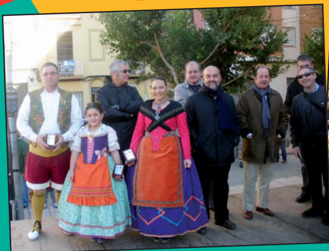
Gaiata 4 L'Armelar