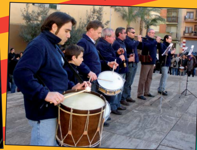
La Colla del Grau