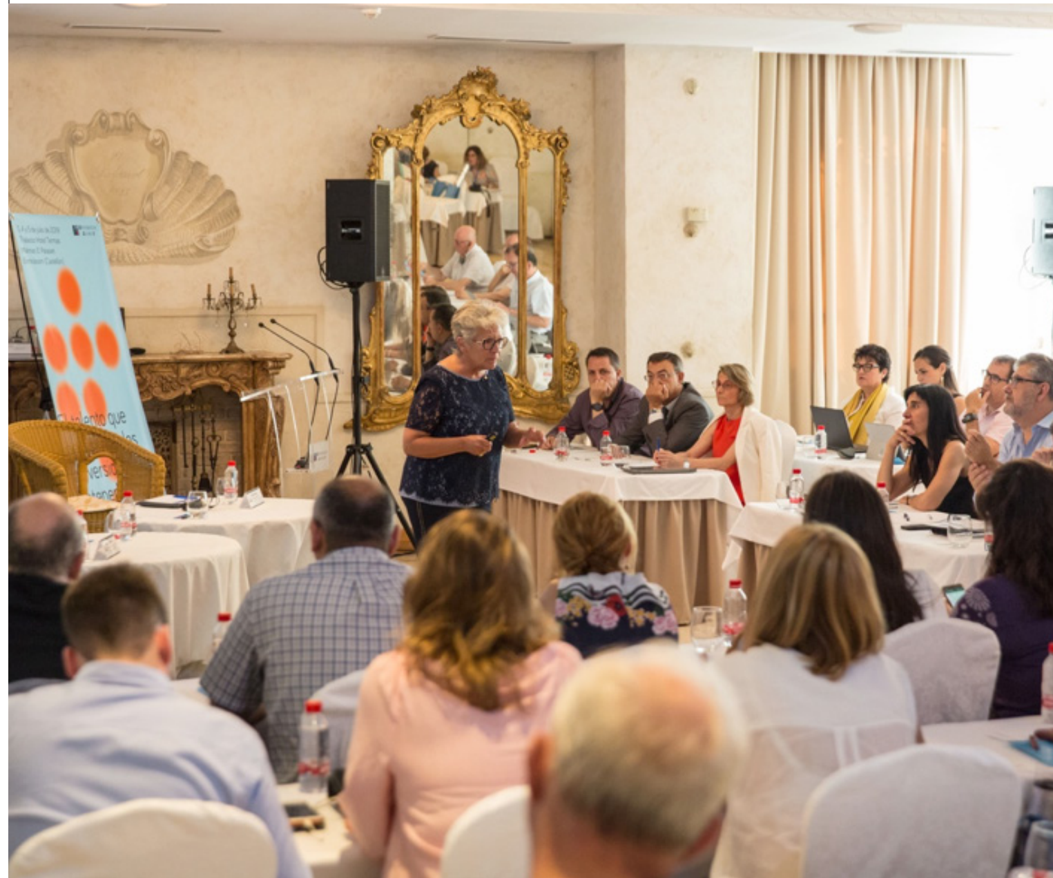
Taula 4. Internacionalització i territori

En el vessant comunicatiu del programa cal destacar la inclusió de nous continguts en el web del Programa de mecenatge i patrocini ( www.mecenazgo.uji.es ); l'enviament de 8 números del butlletí electrònic NEXUS (Butlletí Universitat, Empresa i Institucions); 8 números també del butlletí CATHEDRA , amb informació de les activitats realitzades per les càtedres i aules d'empresa de l'UJI, i la realització de 28 edicions del programa de ràdio Conexión Universidad-Empresa en l'emissora Onda Cero de Castelló, en el qual s'han entrevistat 28 entitats que tenen projectes de col·laboració amb l'UJI; també s'han difós més de 110 notícies de la relació de la Universitat Jaume I amb el sector empresarial.