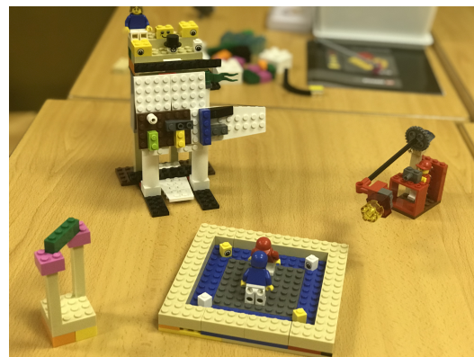
Figura 3: Ejemplo de modelo grupal (4.º RETO).

relacionados con la idea que les apasiona como grupo. Durante la fase de construcción el equipo debe adaptar el modelo resultante del reto anterior para representar los problemas que puedan tener una solución informática. Aunque en este reto solo se representará la parte del problema. Al finalizar cada grupo reflexiona sobre el modelo creado y elige alguno de los problemas representados para el próximo reto. En la Figura 3 se puede observar el modelo de la Figura 2 ampliado durante el 4.º RETO para representar la parte de los problemas. Se puede observar como la representación del problema es más compleja y lo más importante ahora compartida por todo el grupo.