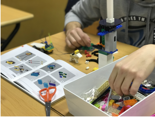
Figura 1: Alumno construyendo la torre (2.º RETO).

que los miembros del equipo empiecen a conocerse y a compartir reflexiones sobre su trabajo. En la Figura 1 se puede observar como un alumno construye la torre durante este reto.