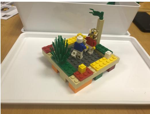
Figura 2: Ejemplo de modelo individual (3.º RETO).