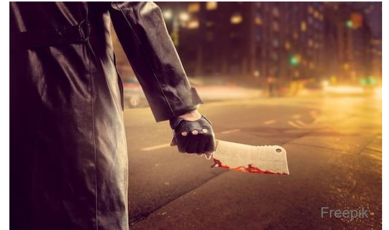
Resolución de casos