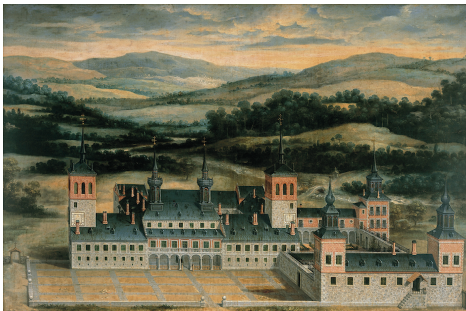
Fig. 1. Félix Castelo, Palacio de Valsain , c. 1633. Palacio Nacional.

En 1557, nuevas referencias sobre nuestro objeto de estudio surgieron cuando el contador de cuentas de su majestad, Juan Muñoz de Salazar, elaboró un memorial para detallar las labores en curso en el Palacio Real de Valsain. 13 En este documento se señala que en el aposento del rey y el patio solo faltaba la colocación del solado de ladrillo y azulejos, así como el proceso de blanqueado. 14