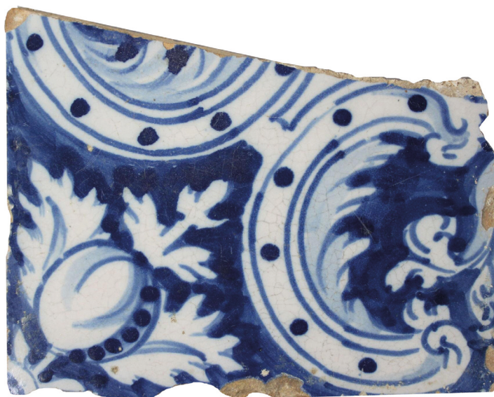
Fig. 5. Azulejo donde aparece una granada plasmada, 1600-1624. Talleres de Toledo. Museo Victoria and Albert, Londres. Número de inventario: C.45-1995

En el exterior de este nuevo proyecto arquitectónico se diseñó una extensa plaza para albergar celebraciones regias, junto con amplios jardines que incluían ermitas, fuentes, estanques y un canal navegable. En el interior del espacio palaciego, se construyeron grandes galerías con salas continuas dispuestas en fila al estilo italiano. En la zona baja se ubicaron las habitaciones de verano de los reyes, mientras que en la primera planta se encontraban las salas de carácter público y las dependencias de la familia real. Cabe destacar que el antiguo Cuarto de San Jerónimo fue destinado como la estancia privada de Felipe IV. En relación con el uso de cerámica arquitectónica en estos entornos, se encuentran registros de zócalos de «tres brazas» de altura en la zona baja y la pavimentación del nuevo Cuarto Real con azulejos de Talavera, adornados con motivos «de la granada grande», 43 seleccionado personalmente por el propio conde-duque de Olivares. 44