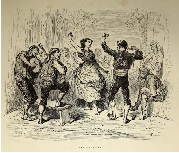
Ilustración 1. La jota aragonesa, Gustave Doré (1875).