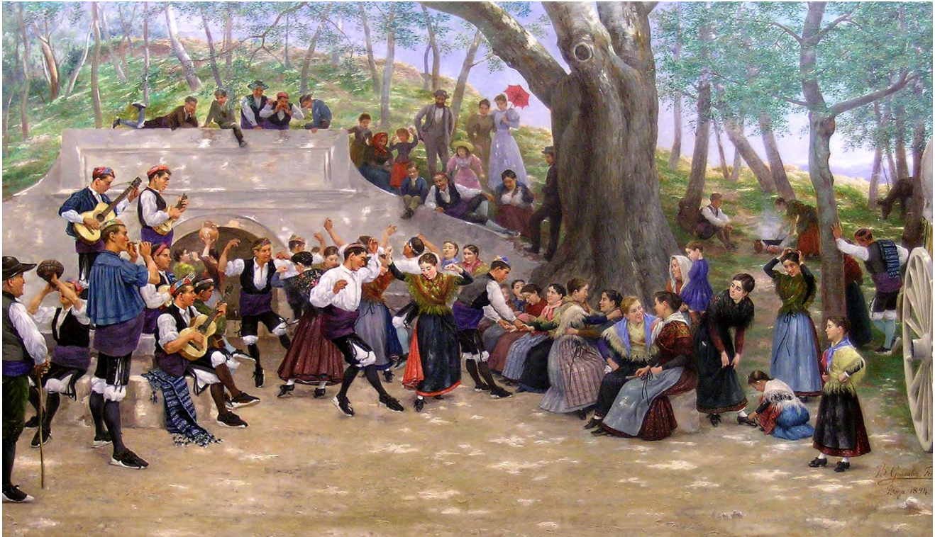
Ilustración 3. La jota en el santuario de la Misericordia , Baltasar González Ferrández (1894). Museo de Zaragoza.

Exposición Nacional de Bellas Artes de 1895 junto a otras cuatro obras. La jota en el santuario de la misericordia es un lienzo de grandes dimensiones (90 x 160 cm) en el que el autor representó a un grupo de jotos frente a la fuente de Los Canales del santuario de la Misericordia en la localidad de Borja. Pueden verse representados abundantes personajes ataviados con indumentaria campesina, asistiendo a la representación musical. La escena posee un fuerte carácter festivo y popular y Baltasar González supo dotarla de dinamismo, tanto en la captación del movimiento del baile, como en la representación de los diferentes grupos de personajes en conversación. Por otra parte, tal y como es habitual en la pintura de género, pueden apreciarse diversas actitudes en los diferentes grupos de personajes, desde los que atienden a la representación musical —entre los que cabe destacar un hombre, dos mujeres y una niña elegantemente vestidos—, hasta los campesinos que aparecen cocinando migas en un fogón bajo los árboles. La obra fue reproducida en la célebre revista catalana La Ilustración Artística (1894, p. 666).