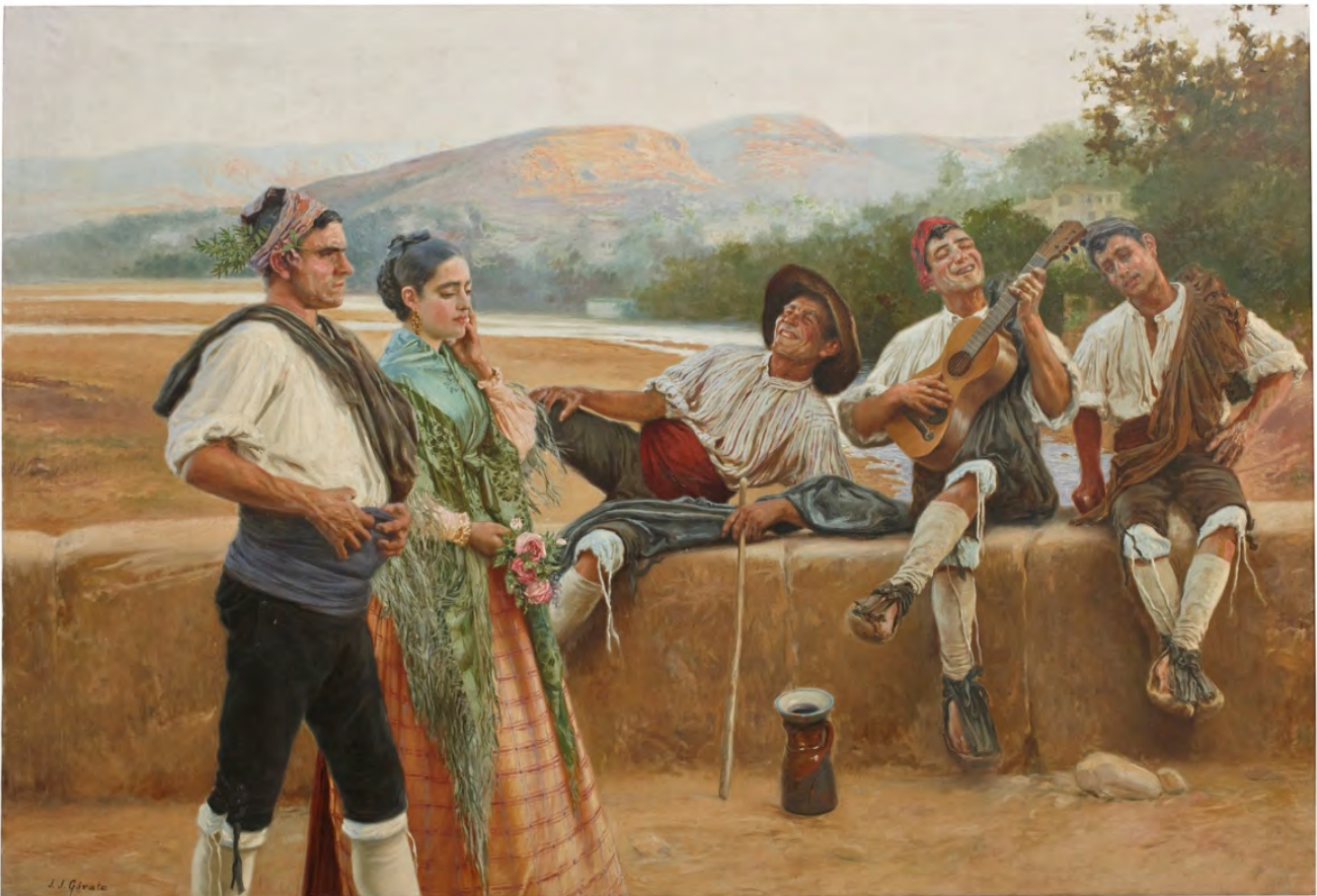
Ilustración 6. Una copla alusiva , Juan José Gárate Clavero (1903). En depósito del Museo de Zaragoza, Museo Nacional del Prado, nº de inventario: P006801.

contraste entre los colores claros de las casas, el cielo estrellado de un intenso color azul oscuro y los ropajes negros de los rondadores. Los únicos instrumentos que portan son guitarras, a las que acompañarían con el canto. Sobresale la capacidad del artista para representar los contorsionados cuerpos de los músicos, transmitiendo su apasionado movimiento y llegando a una estética casi expresionista, similar a la de algunas de sus representaciones de danzas andaluzas. Esta pintura inspiró al director teatral ruso Vsevolod Meyerhold para idear una pantomima que tituló Los enamorados , con música del compositor francés Claude Debussy, y que estrenó de forma privada en enero de 1912 en San Petersburgo (García Guatas, 2005, p. 387).