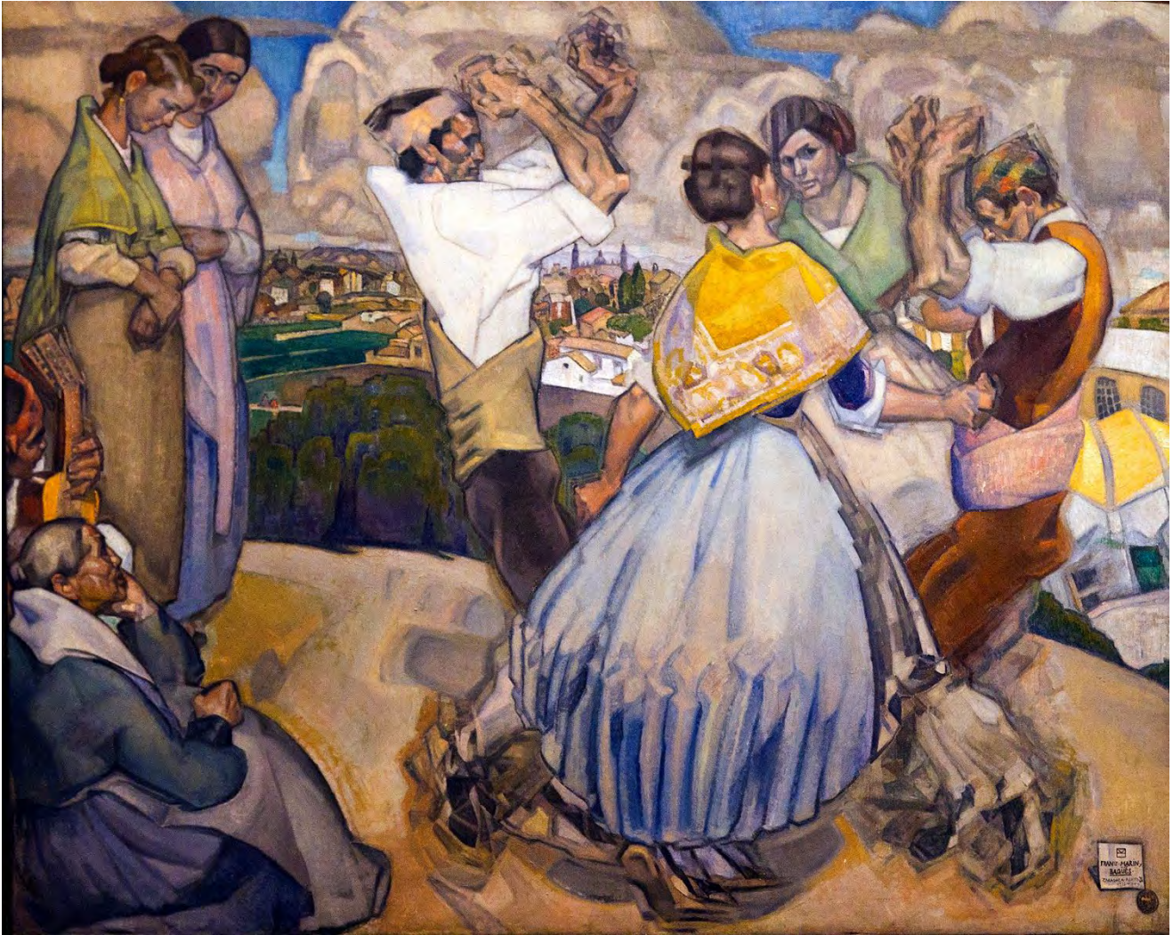
Ilustración 10. La jota , Francisco Marín Bagüés (1932). Museo de Zaragoza, nº de inventario: 10234.

rece presidida a la izquierda por la figura de una muchacha desnuda tocando una guitarra, sobre lo alto de un promontorio que se eleva sobre el paisaje. Al fondo, el artista representa unos campos con personajes bailando jotas, directamente reducidos a manchas de color muy esquemáticas, casi abstractas. Aun así, podemos apreciar como todos ellos van vestidos con el atuendo tradicional aragonés y aparecen representados en distintas actitudes, sobresaliendo el grupo que aparece en el primer plano en el que podemos distinguir a dos parejas mixtas bailando una jota, una representación muy habitual que ya hemos constatado en autores anteriores. La pincelada expresionista, la luz contrastada y los vivos colores son los protagonistas de esta moderna composición en la que se pretende ensalzar la jota aragonesa a través de esta feliz alegoría. A este respecto, es importante señalar la profun-