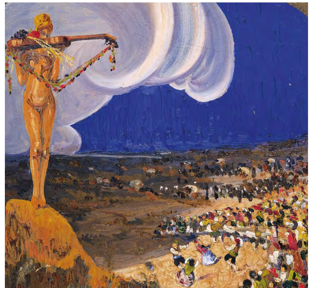
Ilustración 9. Alegoría del baile , Ramón Acín Aquillué (1932). Museo de Huesca, nº de inventario: 05042.

En definitiva, de todos los autores de la pintura regionalista aragonesa, Gárate fue el que con mayor frecuencia incluyó la jota en sus representaciones. Los propios títulos que el artista dio a sus obras hacen explícito el contenido musical de las escenas, en las que la jota se convierte en un ingrediente —tan importante como la indumentaria o la localización— para la génesis de la identidad regional aragonesa, aunando los conceptos de raza, carácter y tradición, fundamentales en los discursos identitarios de la época.