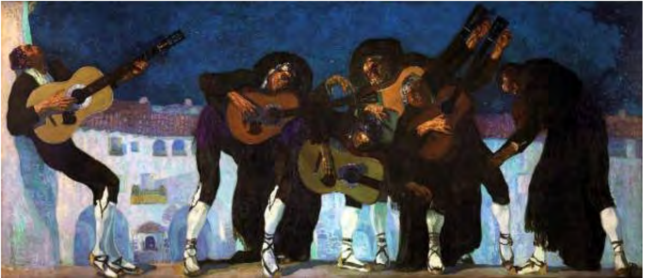
Ilustración 5. Los enamorados de Jaca o La rondalla de Jaca , Hermenegildo Anglada Camarasa (Ca. 1910). Museu Víctor Balaguer de Vilanova i la Geltrú, nº de inventario: 2430.