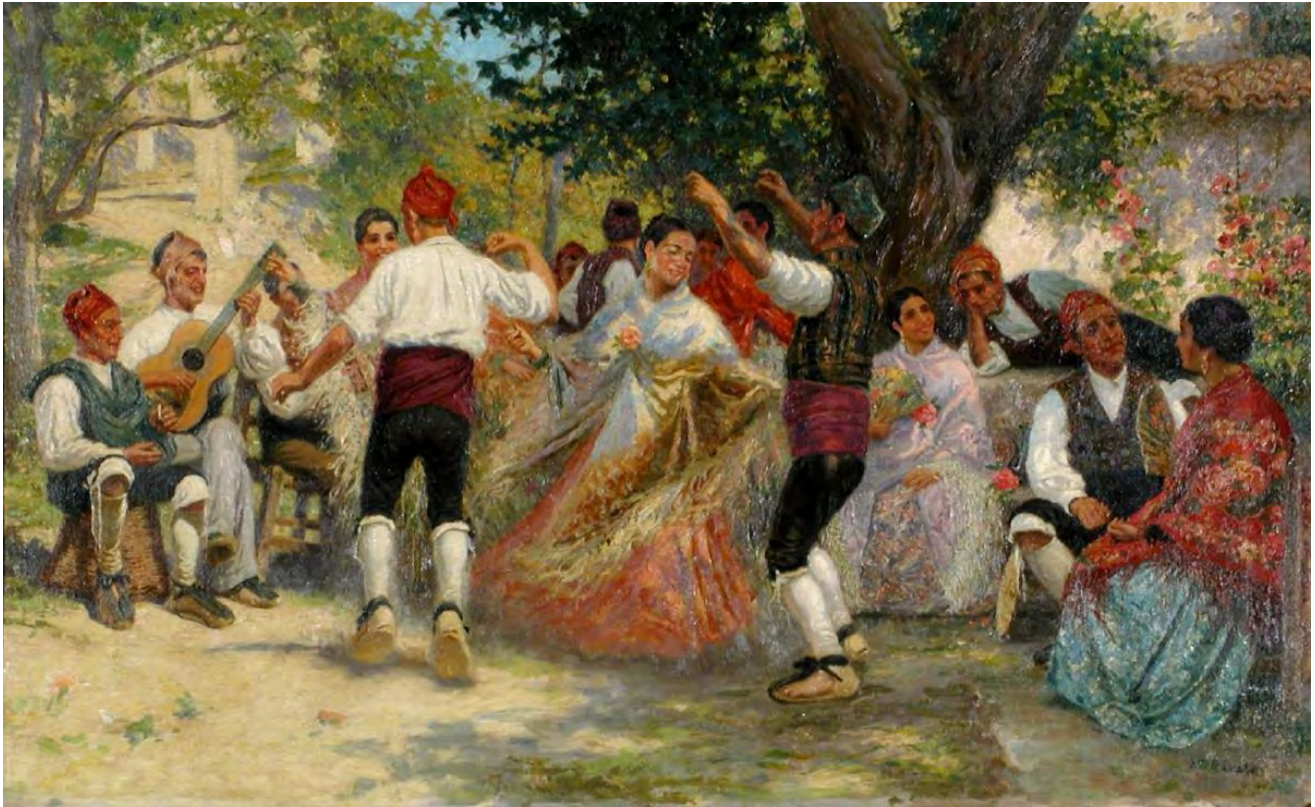
Ilustración 7. Baile de la jota , Juan José Gárate Clavero (1924). Museo de Zaragoza, nº de inventario: 51126.

del Arzobispo, localidad natal del artista. Sin embargo, el cuadro encierra un significado más profundo, el de la puesta en cuestión de la virtud de la joven a través de la copla que canta el personaje que aparece sentado en el medio (Val Lisa, 2019, p. 54).