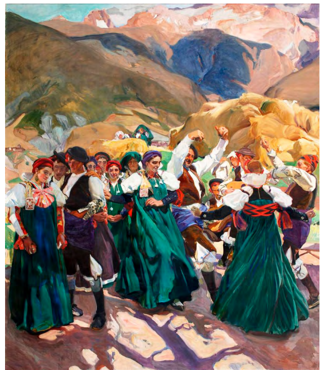
Ilustración 4. Aragón. La jota , Joaquín Sorolla (principios del siglo XX). Hispanic Society of America, Nueva York, nº de inventario: A1803.

Exposición Nacional de Bellas Artes de 1895 junto a otras cuatro obras. La jota en el santuario de la misericordia es un lienzo de grandes dimensiones (90 x 160 cm) en el que el autor representó a un grupo de jotos frente a la fuente de Los Canales del santuario de la Misericordia en la localidad de Borja. Pueden verse representados abundantes personajes ataviados con indumentaria campesina, asistiendo a la representación musical. La escena posee un fuerte carácter festivo y popular y Baltasar González supo dotarla de dinamismo, tanto en la captación del movimiento del baile, como en la representación de los diferentes grupos de personajes en conversación. Por otra parte, tal y como es habitual en la pintura de género, pueden apreciarse diversas actitudes en los diferentes grupos de personajes, desde los que atienden a la representación musical —entre los que cabe destacar un hombre, dos mujeres y una niña elegantemente vestidos—, hasta los campesinos que aparecen cocinando migas en un fogón bajo los árboles. La obra fue reproducida en la célebre revista catalana La Ilustración Artística (1894, p. 666).