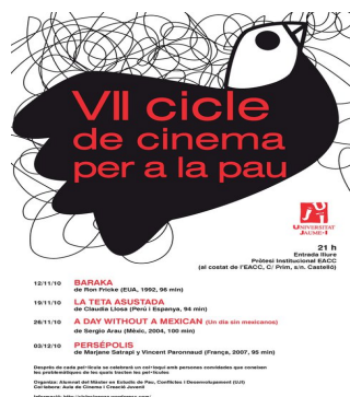
Fig 3: Afiche ciclos de cine para la paz