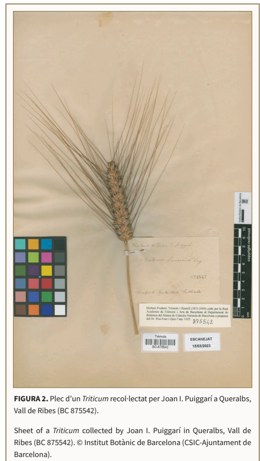
FIGURA 2. Plec d'un Triticum recol·lectat per Joan I. Puiggarí a Querulbs, Vall de Ribes (BC 875542).

Moltes d'aquestes recol·leccions s'han conservat a l'herbari BC de l'Institut Botànic de Barcelona. Recentment, gràcies a la digitalització de l'herbari Trèmols (herbari històric dins de l'herbari BC) feta per Laura