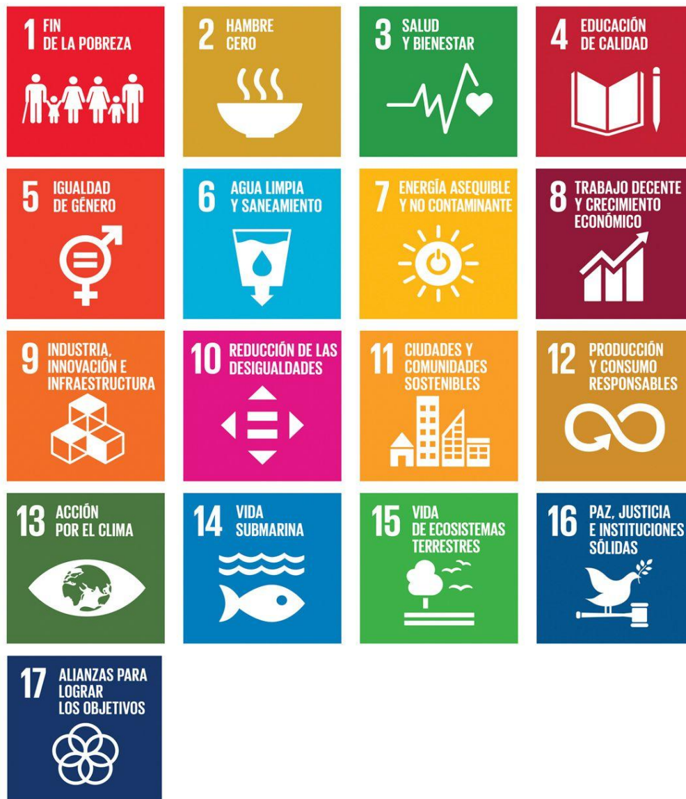
Figura 2: Objetivos de Desarrollo Sostenible. Resolución de la ONU. Agenda 2030.

En la imagen adjunta, se resumen cada uno de los 17 Objetivos de Desarrollo Sostenible: