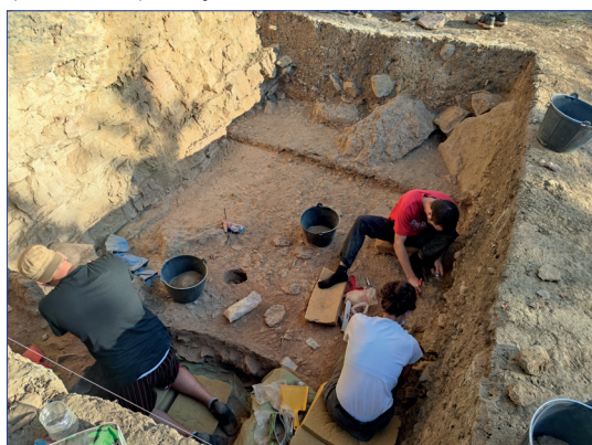
Figura 3.- Excavació de la Coveta de la Foia, (Vilafranca) l'any 2021

Entre els materials de l'epimagdalenianà, caracteritzats per una gran quantitat d'indústria lítica, dominen els elements microlaminars de dors (fets servir com a projectil) i els gratadors (pel treball de la pell dels animals). Entre els primers