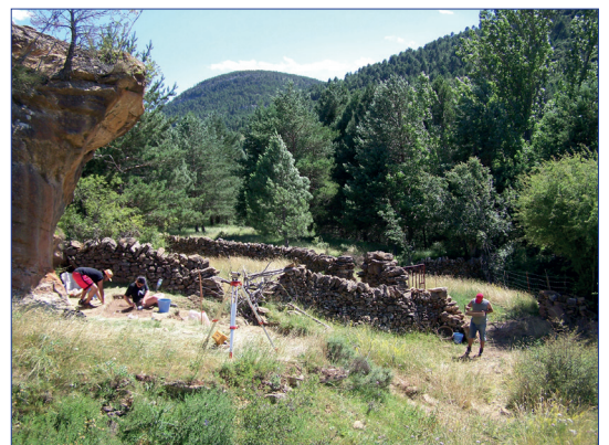
Figura 4.- Excavació en la balma de La Roureda (Vilafranca) l'any 2007

Malauradament els materials orgànics no s'han conservat massa bé en el jaciment, i això fa que les restes de fauna siguen realment escasses. Per tant no tenim evidències directes per reconstruir el paisatge i deduir les pautes d'explotació del medi dels habitants de la Roureda. El que sí que s'ha recuperat són dues peces d'adorn. Concretament es tracta dedues conquilles de gasteròpodes fluvials perforats ( Theodoxus fluviatilis ) que podrien haver estat recol·lectats al mateix riu de les Truites. Les perforacions parlen del seu possible ús per a ser penjats o suspesos, i revelen que la seua presència en un context d'habitatge no està vinculada a un ús econòmic, sinó més bé de tipus estètic, social i/o simbòlic.