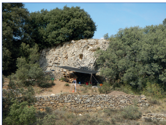
Figura 5.- Vista general de la balma del barranc de la Fontanella (Vilafranca) l'any 2012

mesolítiques. La primera és del mesolític antic, datat entre fa 10570 i 10230 anys (Roman & Domingo, 2021). La segona i la tercera, que no hem pogut diferenciar clarament en l'excavació, pertanyen al mesolític recent (Roman & Domingo, en premsa). Els materials recuperats ens porten a pensar en la presència d'aquestes dues fases recents, el que coneixem com a mesolític recent de la fase A i la fase B.