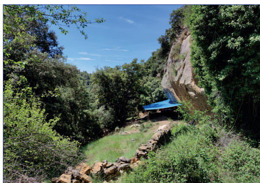
Figura 2.- Vista general de la Coveta de la Foia, (Vilafranca) l'any 2021

El paleolític superior se situa entre fa uns 35.000 i uns 11.000 anys, i comprèn els moments més freds de la darrera glaciació. En el terme de Vilafranca coneixem dos jaciments que s'adscriuen al final d'aquest període: la Coveta de la Foia i la balma de la Roureda. La intensitat en què han estat ocupats els jaciments i el context arqueològic regional ens mostren que en aquests moments és on sembla consolidar-se el poblament humà en aquestes zones interiors i muntanyoses.