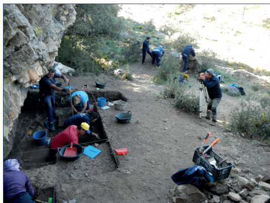
Figura 6.- Excavació en la balma del barranc de la Fontanella (Vilafranca) l'any 2015