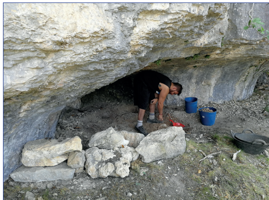
Figura 7.- Excavació en la balma de la Font d'Horta (Vilafranca) l'any 2017

L'excavació es va portar a terme al juliol de 2017, coincidint amb les excavacions que realitzàvem en aquells moments en la Coveta de la Foia. Aquests treballs ens van