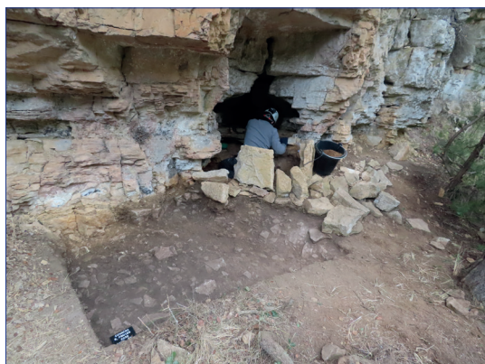
Figura 1.- Excavació en la Covacha del barranco de los Frailes (Mosquerola) l'any 2020

Tot i que aquest període no és un dels objectius principals dels nostres projectes, els quals se centren en moments més avançats, en el marc de les nostres excavacions hem recuperat una evidència de la seua presència en aquest territori. Es tracta d'una punta Levallois , peça característica d'aquest període, apareguda en l'excavació realitzada a la Covacha del barranco de los Frailes (Mosquerola) (Aguilella et al, en premsa).