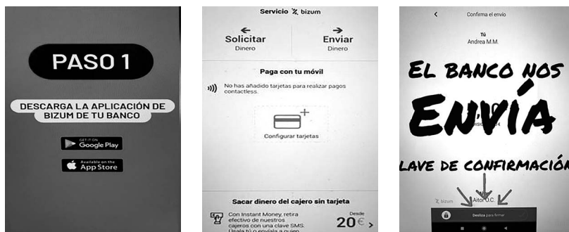
Imatge 1. Píndola formativa amb les etapes a seguir a Bizum