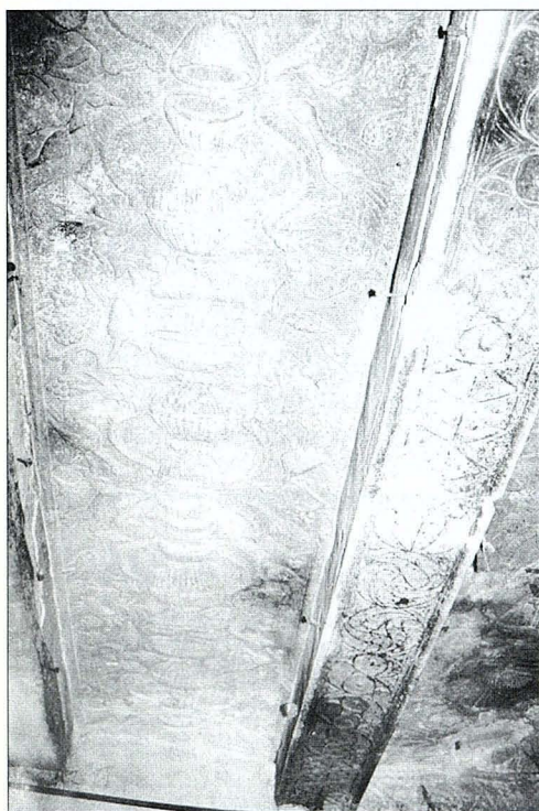
Techo ricamente adornado con artesonados de mampostería de una de las salas del antiguo palacio de los Berga.