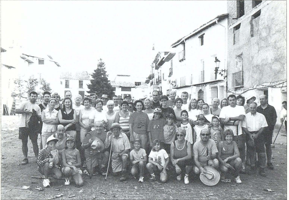
Caminada del dimarts de festes.

del Bergantes». La plaça de Forcall es va cobrir amb un mant de sorra, i els cadafals, col·locats estratègicament, van servir per que tot homtothom pugues gaudir de l'espectacle. Les diferents colles van animar la jornada amb sentit de l'humor i disfresses, recreant l'ambient d'un dia de «Corrida».