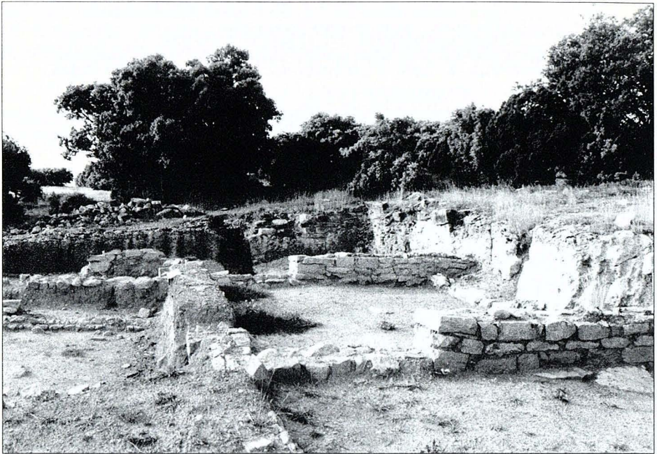
Vista de la zona donde se realizan los trabajos arqueológicos.

Es importante proseguir con estas actuaciones en la única urbe romana existente entre Sagunto y Tortosa, ya que supone poner de relieve esta población aumentando el conocimiento de la misma y, en consecuencia, su utilización como reclamo turístico dinamizador de la población, además de poder tener más cerca de nosotros una fuente de conocimiento cultural de la forma de vida de nuestros antepasados.