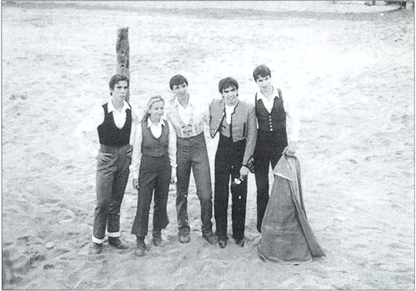
A l'exhibició de l'Escola Taurina de Castelló no va faltar de res, al damunt els alumnes de l'escola saludant al públic, al davall tots els elements de la festa parodiats per iniciativa de varies colles.