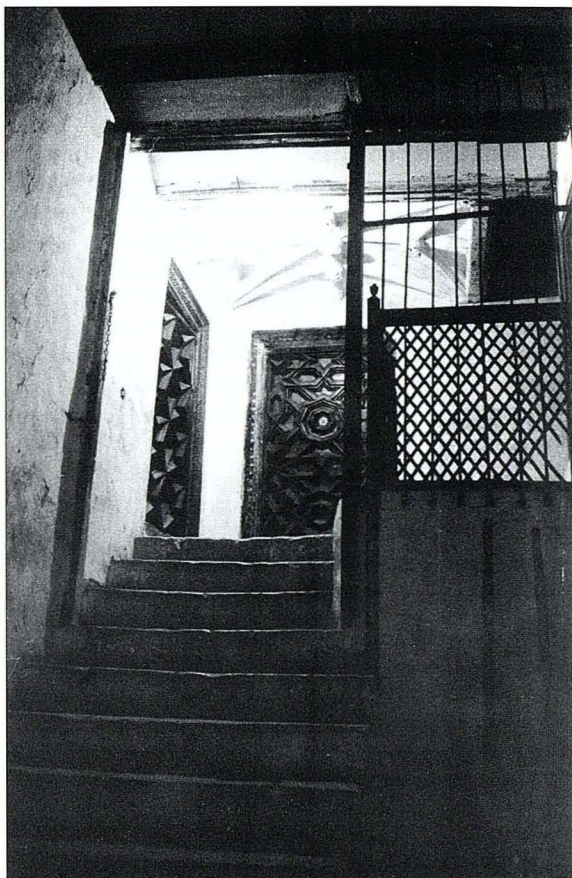
Escalera en el interior del palacio.