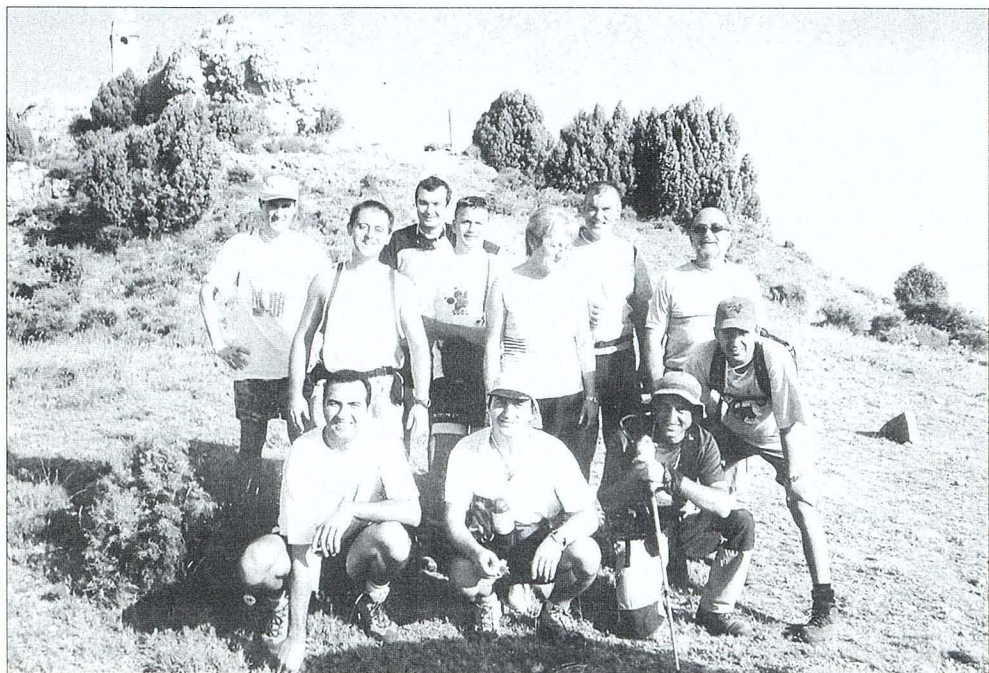
Un grup de caminants al peiró de Sant Joaquim de la Menadella.

Segueix fins a la Todolella. S'agafa el sender PRV 228 que arriba a la Roca de l'Home de