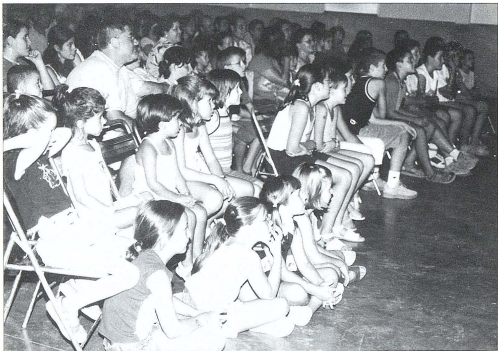
Els més menuts segueixen el teatre.

Al llarg de la vetllada Valentí va fer una dissertació sobre la seua trajectòria i sobre les raons que el van dur a Forcall i les vivències que va tenir al nostre poble. Per tancar l'acte, l'alcalde va fer el lliurament d'una placa commemorativa en nom de tot el poble.