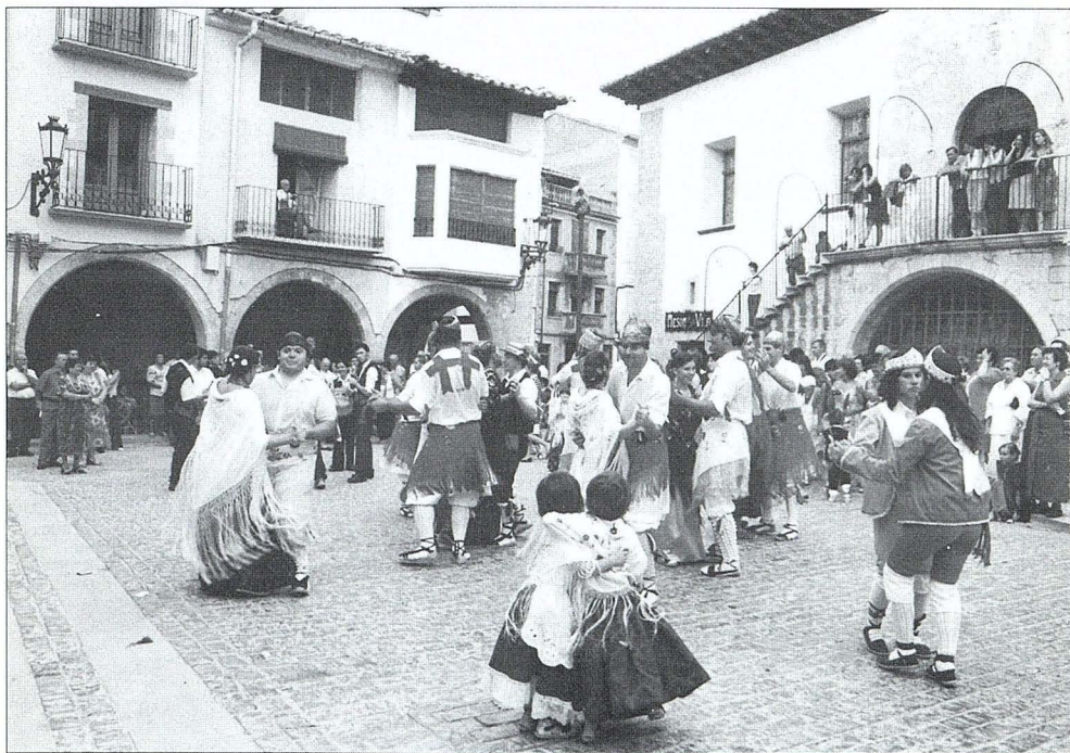
Al final de les danses...

La coetà va tancar aquests dies de tradicions per donar pas a una programació més lúdica, en la que els bous van tenir un lloc prominent, destacant un bou embolat amb cinc boles i l'exhibició que van fer els alumnes de l'Escola Taurina de Castelló. Entre els alumnes participants el més aplaudit va ser el forcallà Castel conegut en cercles taurins com «El Niño