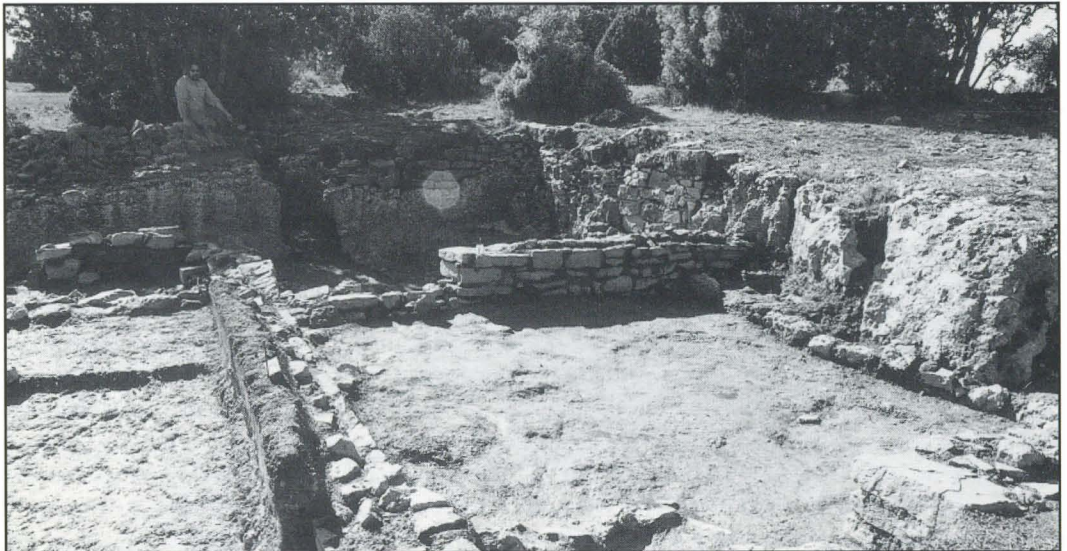
Zona excavada por Ferran Arasa en septiembre de 2001