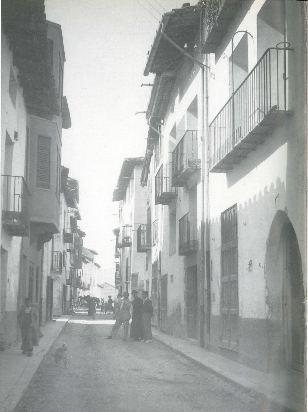
FORCALL C. S. VICENTE