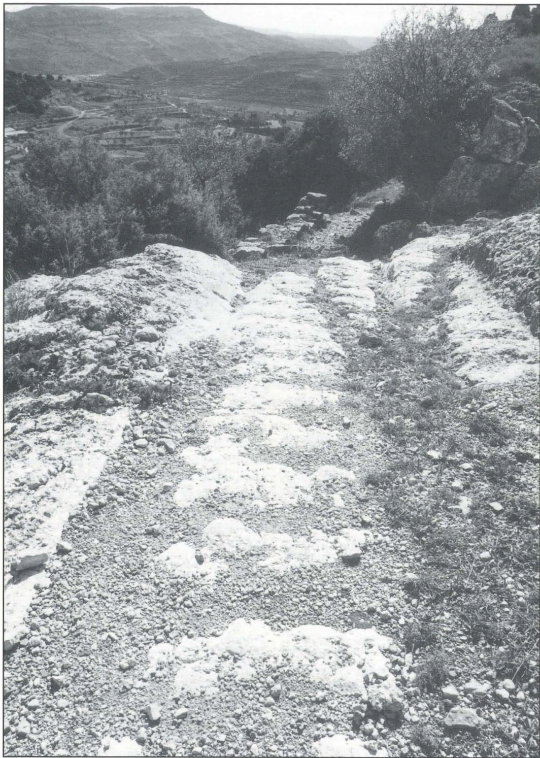
Marcas de ruedas de carro en la zona de entrada a la Moleta dels Frares