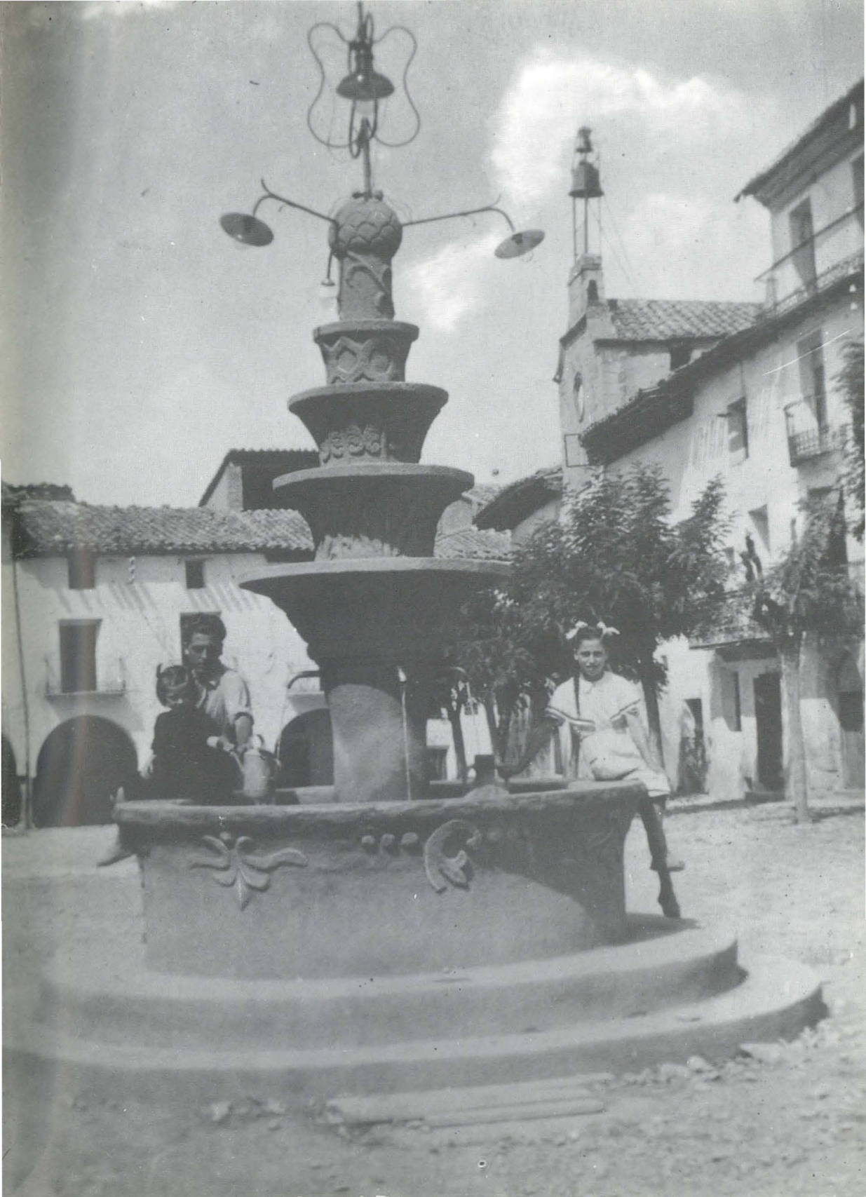
FORCALL FUENTE DE LA PLAZA