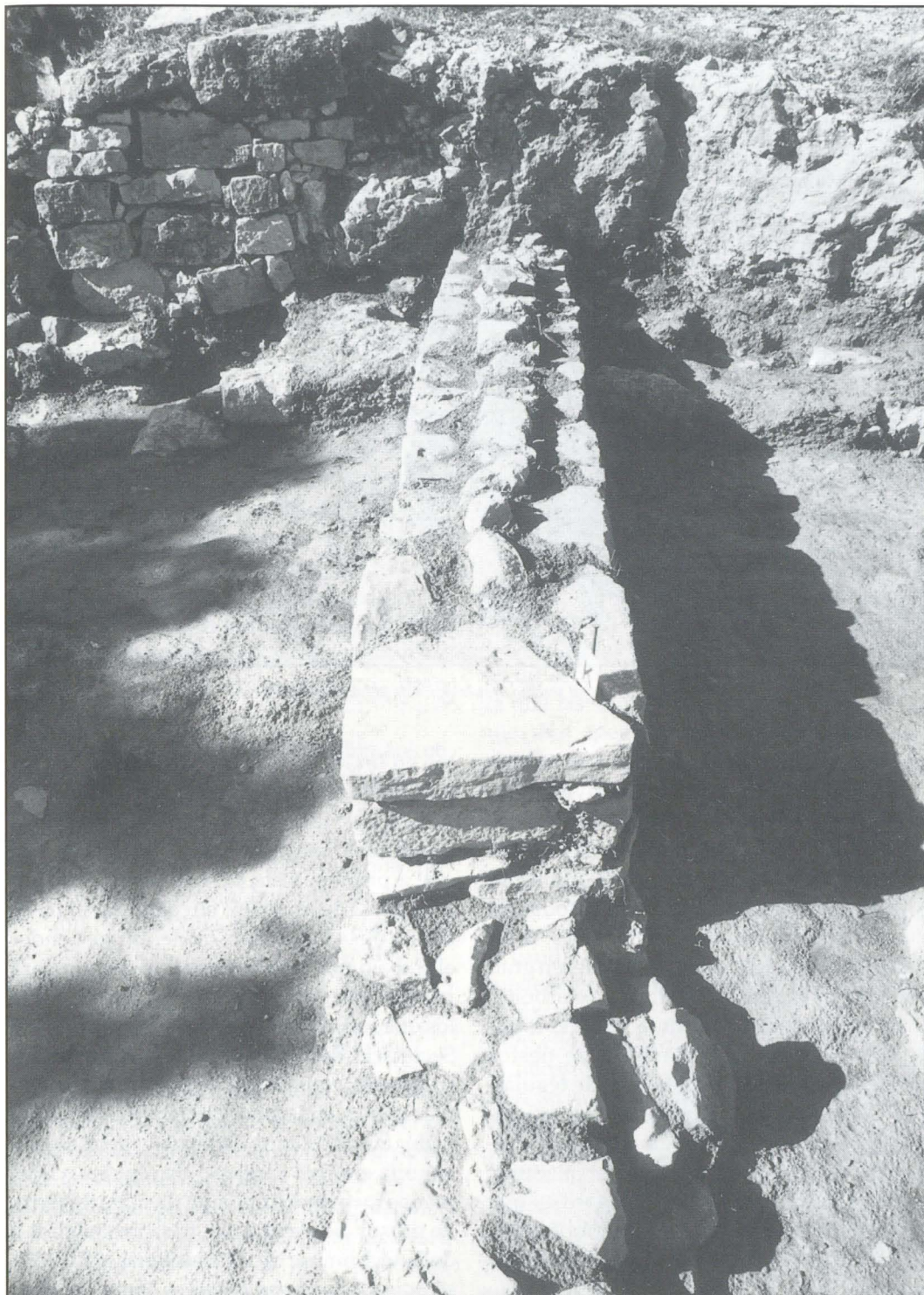
Detalle de la excavación arqueológica. Septiembre 2001