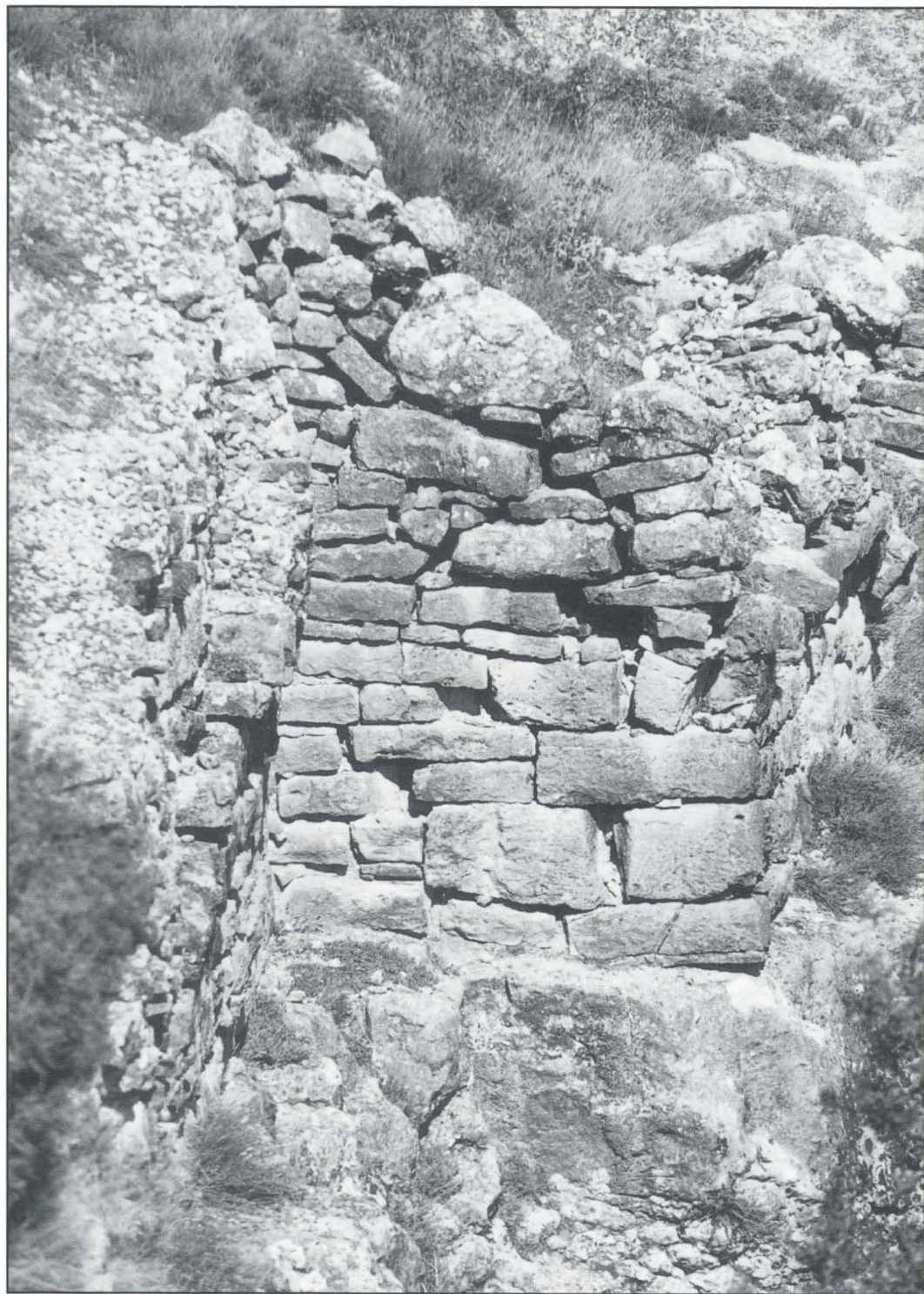
Tramo de muralla al Norte de la entrada a la Moleta