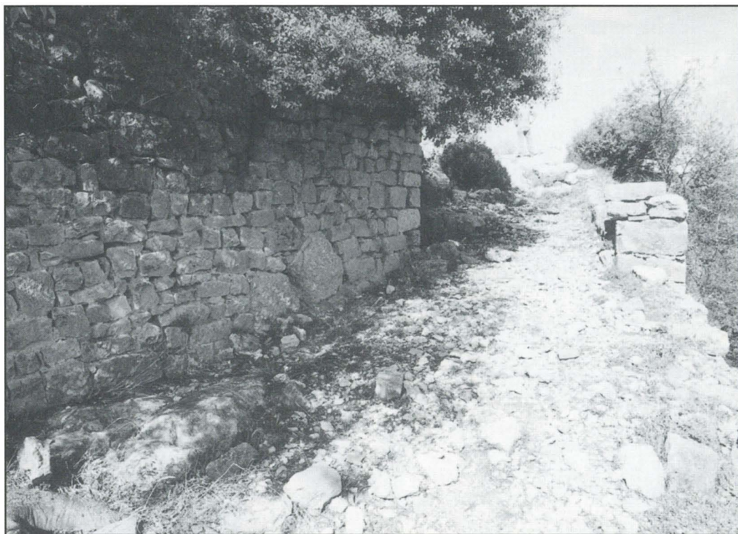
Puerta de acceso al recinto arqueológico de la Moleta dels Frares

ma superior, bien que la torre a la que alude Ferrer no existe ya, por lo menos visible en la forma que él indica. Allí hay zonas en las que aflora la roca, pero otras en las que se descubren alineaciones de piedras que señalan otras tantas paredes, que tienen todas las características de limitar habitaciones. El terreno está virgen de arado y en él crecen gran cantidad de arbustos y verdaderos árboles, junto con maleza abundante. Ello no impide se descubran gran cantidad de tuestos antiguos en especial fragmentos de téglulas, que se encuentran por todas partes. Señalemos el hallazgo de dos fragmentos bien típicos de cerámica helenística o campaniana, una correspondiente a especies tardías que pueden fecharse a finales del siglo II antes de la Era, y el otro de especie más antigua, acaso del siglo III.