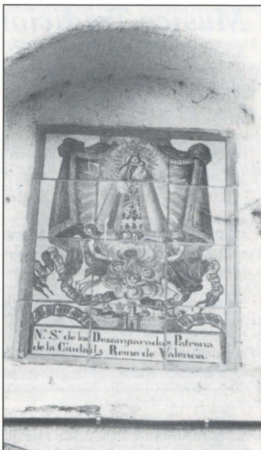
Ntra. Sra. de los Desamparados. Bella cerámica alcoreña. Ofrece un especial interés porque en tal fecha, 1848, el edificio era todavía Hospital hasta 1877, en que se inauguró el nuevo.