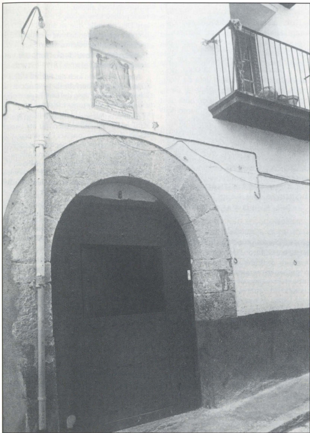
Fachada del antiguo Hospital que dio nombre a la calle, hoy de los Desamparados.