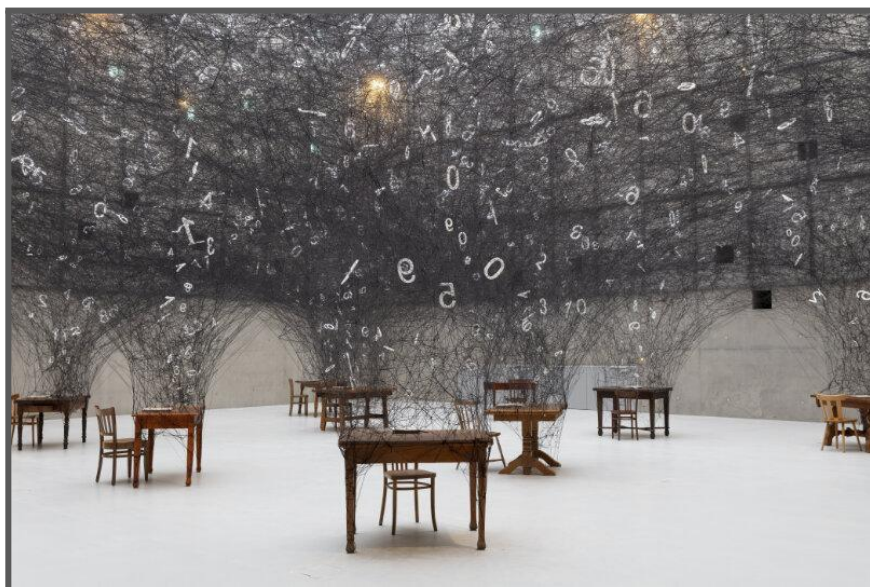
Cita visual. Counting Memories (2019), de Chiharu Shiota.

L'obra elegida s'anomena Counting Memories , i aquesta va ser realitzada per l'artista Chiharu Shiota en l'any 2019. Aquesta és una instal·lació on es poden observar diversos escriptoris repartits per tot arreu amb diverses cadires. De cadascun dels escriptoris s'eleven llargs fils negres entrelligats que formen un gran núvol obscur en la part superior de l'habitació. A més a més, entre aquest núvol de fils negres trobem nombres de color blanc atrapats al seu interior.