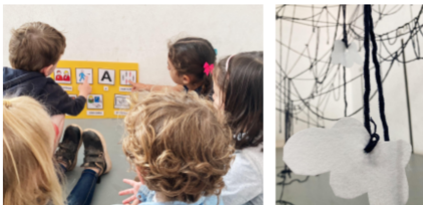
Autora (2023) Assaig fotogràfic compost per dos imatges de les adaptacions.

A l'hora de desenvolupar aquesta proposta s'han tingut en compte les característiques i necessitats de l'alumnat que conforma la nostra aula. Per aquest motiu, per a l'alumnat amb Necessitats Específiques de Suport Educatiu (NESE), d'una banda s'ha comptat amb el recolzament de la docent de suport per tal de facilitar l'ajuda necessària amb la finalitat que pugui realitzar l'activitat. D'altra banda, s'han creat pictogrames amb la finalitat d'introduir l'activitat per tal que es pugui entendre quina és l'activitat que es va a dur a terme. A més a més, s'han creat figures de núvols amb feltre, les quals estan col·locades en alguns dels fils de llana, per tal de cridar l'atenció de l'alumnat i que sigui promotor de l'interès i participació d'aquest.