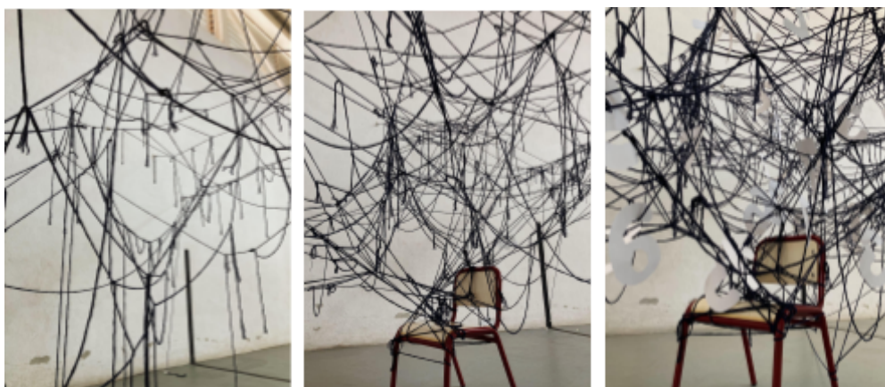
Autora (2023). Assaig fotogràfic compost per tres fotografies del procés.

Per últim, com a resultat final de la proposta duta a terme, és la constant participació, col·laboració i ajuda mútua entre l'alumnat, qui es comunicava i suportava contínuament per aconseguir fer cada volta més nusos i transformar l'espai en un gran núvol de fil negre. A més a més, un fet a destacar és la motivació amb la que han treballat al llarg dels dies, i la il·lusió que els feia realitzar l'activitat i treballar amb un material tan simple com és un cabdell de llana.