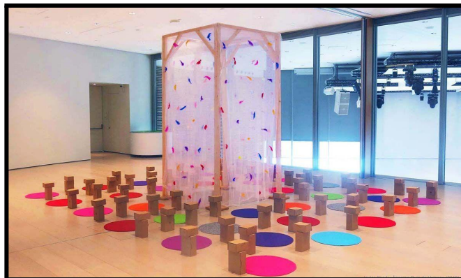
Cita Visual. Alas (2019), de Javier Abad y Angeles Ruiz.

Alas (2019), és una de les instal·lacions de joc de l'artista Abad que ha servit d'inspiració per treballar la nostra peça degut a la disposició del material en l'espai, la simplicitat d'aquest, i de la possibilitat d'experimentació, manipulació i joc que possibilita.