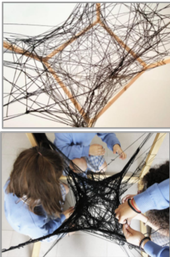
Autora (2023) Cita visual. Arte para Aprender, (2021).

Una de les principals accions dels projecte Arte para Aprender sobre les que ens hem inspirat per treballar l'obra posterior és Telaraña negra, escultura colaborativa de hilos de lana negra en el interior de un cubo , una intervenció basada en l'obra de Carlos Cruz-Díez i una obra de Sol LeWitt. Aquesta ens ha servit de model inspirador degut a l'utilització de fils de llana com a material principal per compondre una peça artística, i d'igual manera, la metodologia de teixir aquests fils per transformar un espai.