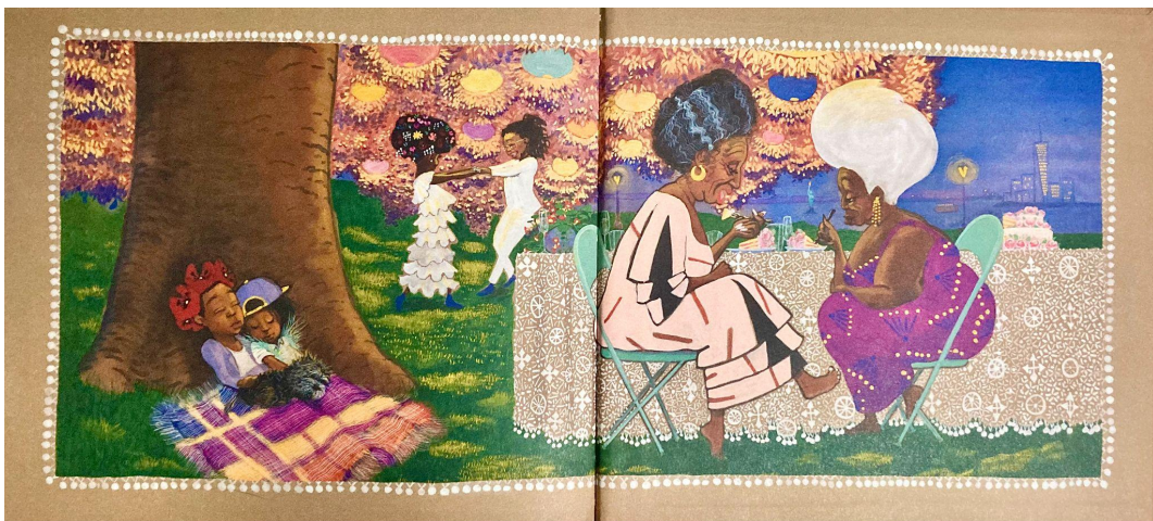
Imatge 4, il·lustració final amb marge.