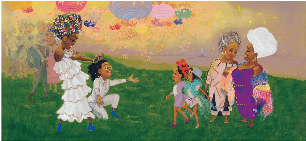
Imatge 2, il·lustració a doble plec.