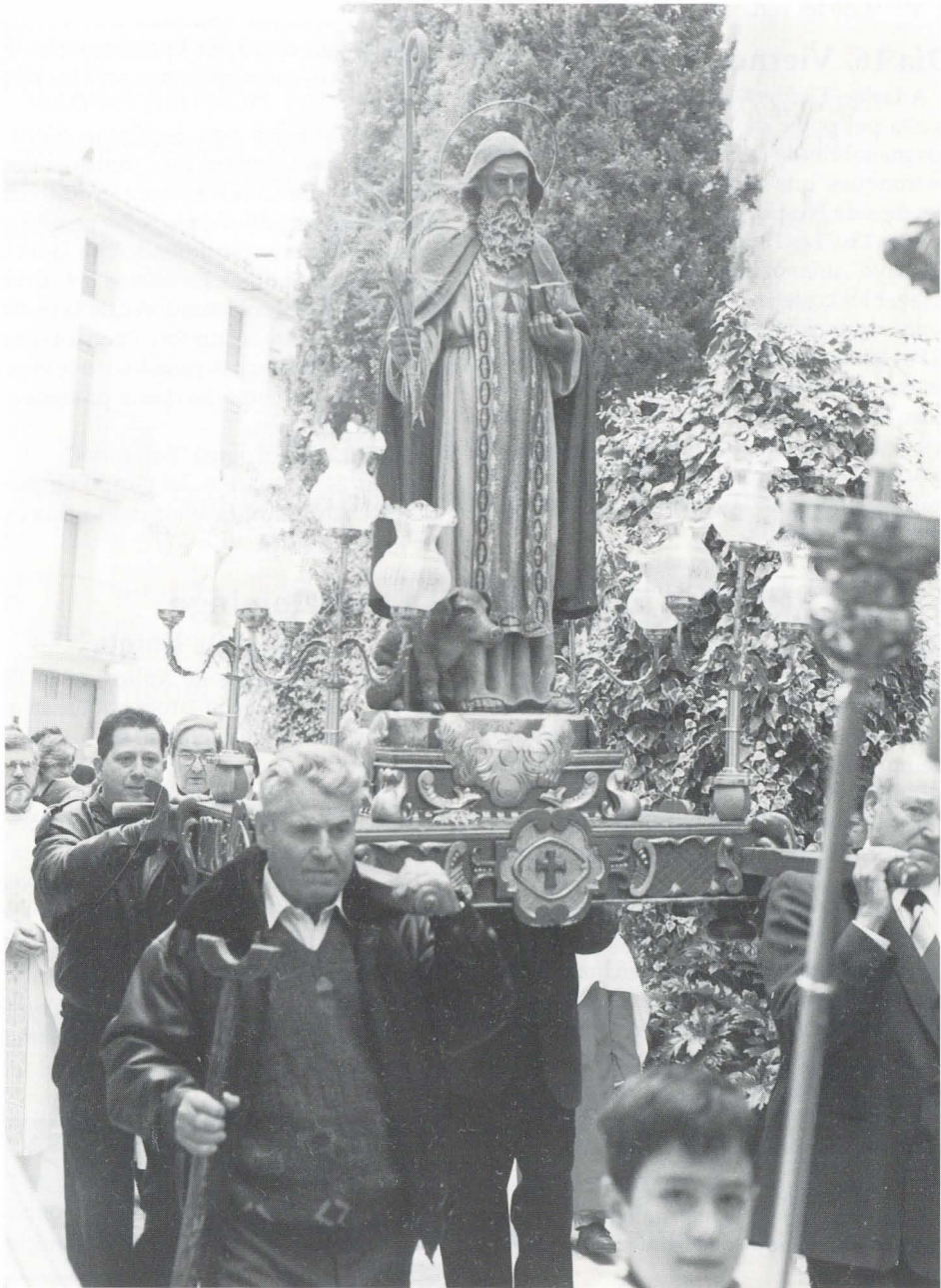
Sant Antoni 1996.