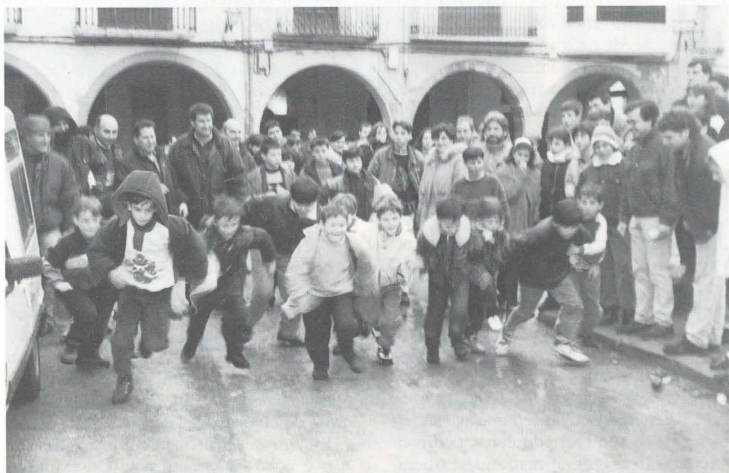
Sant Antoni 1996.