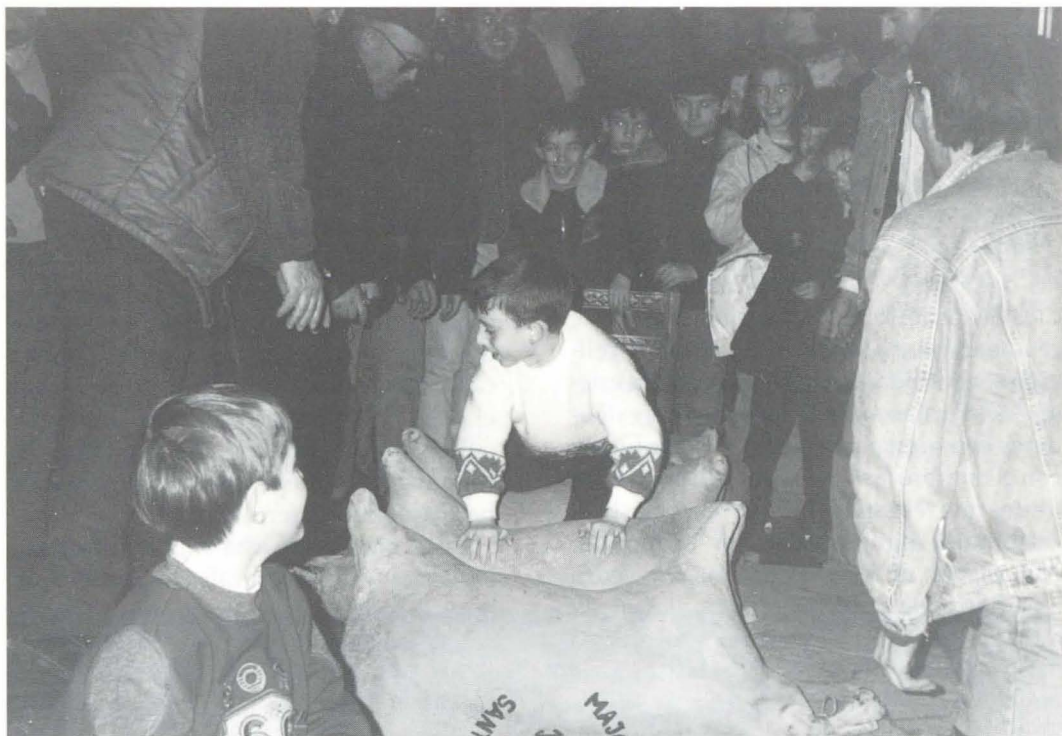
Sant Antoni 1996.