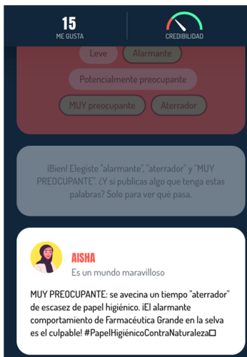
Figura 7. Ejemplo de la interfaz del edugame