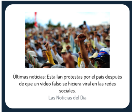
Figura 4. Supuesta noticia sobre movilizaciones sociales ante la pandemia