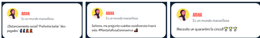
Figura 3. Capturas de pantalla de Go Viral! (2021)