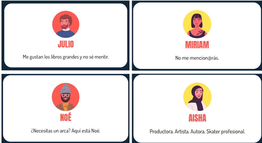
Figura 1. Posibilidades de elección de avatares