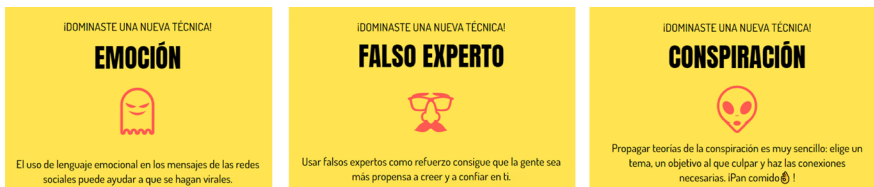
Figura 2. Técnicas alcanzadas con la evolución del jugador