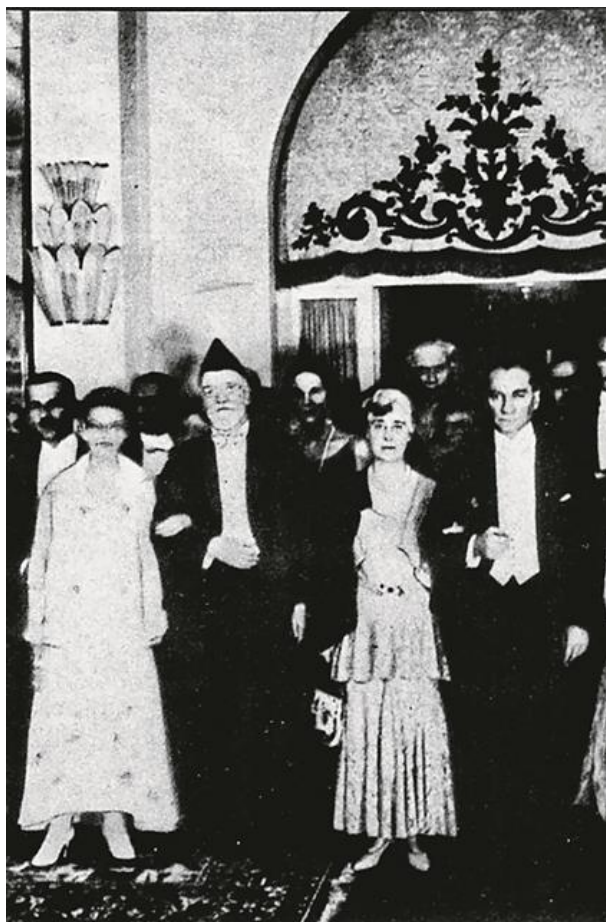
Eleythérios Venizelos i Kemal Atatürk, l'un de bracet amb la dona de l'altre, a la recepció a Ankara que tingué lloc després de la signatura del Tractat d'Amistat Greco-turc, el 30 d'octubre de 1930

El resultat polític dels sacrificis grecs va ser el Tractat d'Amistat i Estabilitat, Conciliació i Arbitratge signat pels dos dirigents a Ankara el 30 d'octubre de 1930. Així, els refugiats grecs van ser privats de les indemnitzacions que esperaven per les propietats perdudes, encara que Venizelos els va fer veure que l'estat grec havia gastat 80 milions de lliures per restablir-los.