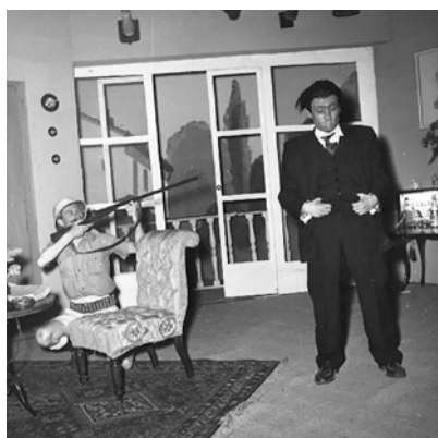
Fig. 12. Una bomba llamada Abelardo , 1953, foto de Basabe, Museo Nacional del Teatro, FT15982.