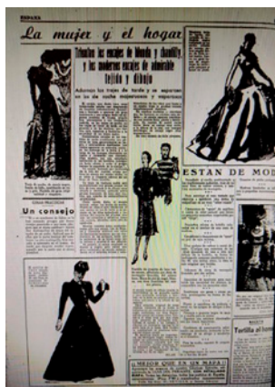
Fig. 8. «La mujer y el hogar», España , 17-11-1938.