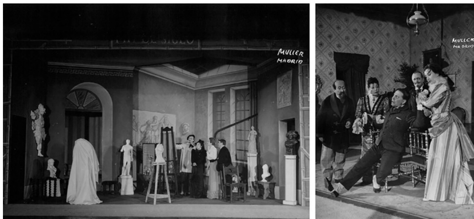
Fig. 13. Fin de siglo, 1953