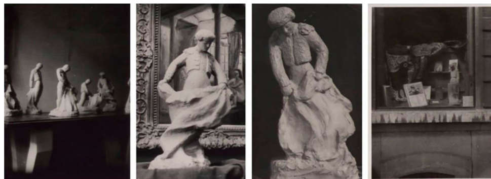
Figs. 5 y 6. Fotografías del escaparate de la Galerie d'Art Hispanique y de los toreros, 1952. AGSM. Pilar Calvo Rodero, piezas taurinas, 1952.