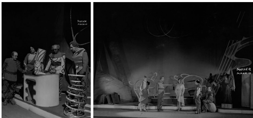
Fig. 14. Otoño del tres mil seis , 1954, foto de Nicolás Müller, CDAEM, FOT-727784 y FOT-727786

se combinaba con elementos de atrezzo de marcada geometría (Fig. 15). 52 A pesar de la originalidad de la temática, las críticas fueron negativas. Uno de los más duros con la labor de Calvo y Cortezo fue Torrente, desde las páginas de Arriba : «La puesta en escena no ayudó, antes bien, colaboró en el escaso éxito de la obra. Son graciosos los decorados, pero los trajes son horribles» (Torrente, 1954). Por su parte, Elías Gómez Picazo opinó de forma similar: «Difíciles y originales los decorados. En cuanto a la vestimenta, hubo muchos comentarios, y no precisamente favorables» (1954).