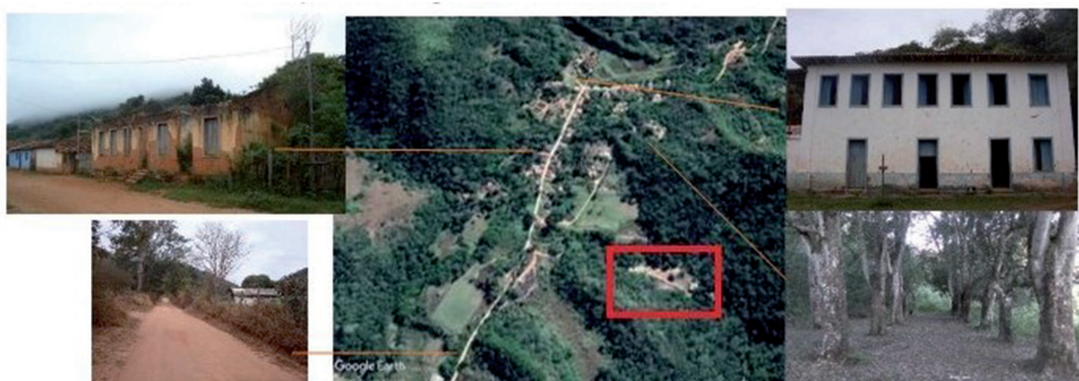
Fig. 8. Localizaciones de los causos : a lo largo del camino principal; en el hotel del ‘Coronel Magalhães’; en la antigua plaza; abajo a la derecha, el centro cultural que descentra la antigua plaza como lugar de conmemoración de las Fiestas del Agua (Fuente: elaboración propia sobre imágenes de Google Earth y Souza, 2015).

En el caso de los más jóvenes, violencia y narrativas sobre tratos abusivos y terror generalmente privilegian la época de Magalhães. Especialmente desde la generación que llegó a vivir la fase final de la prisión indígena aún como jóvenes. Varias de estas personas conocían las localizaciones de los lugares relevantes a las prisiones de excepción: las celdas del antiguo hotel, el lugar aproximado en que fueron enterrados los muertos y las historias de violencias contra personas del pueblo Krenak. Pero también imaginaban las violencias que precedieron a sus parientes como tanto mayor cuanto más próxima al “tiempo de Magalhães”, a fin de cuentas el “tiempo de los esclavos” 6 fundacional de la Fazenda. Respecto a la antigua plaza principal, Seu Romildo imaginaba esclavos haciendo cola para comer cuando eran llamados por una sirena. En la misma plaza donde se encuentra el área administrativa, y en cuyo interior se encuentra la celda, el “pirulito” data del tiempo en que la PMMG montó su base contra la guerrilla de Caparaó. Pero Romildo asociaba el conjunto de la disposición de la plaza, inclusive el “pirulito” militar, también al tiempo del Coronel Magalhães. De manera semejante, y discutiendo una serie de fotografías, Arariby retrotraía los militares en ella retratados –también del tiempo de la PMMG y con uniformes idénticos a los que efectuaron las prisiones de la guerrilla de Caparaó– a la época del Coronel Magalhães.