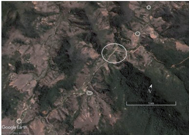
Fig. 3. Centro 'urbano' y destacados en los 'retiros' separados más relevantes (Fuente: elaboración de los autores sobre la imagen de Google Earth de 2005).