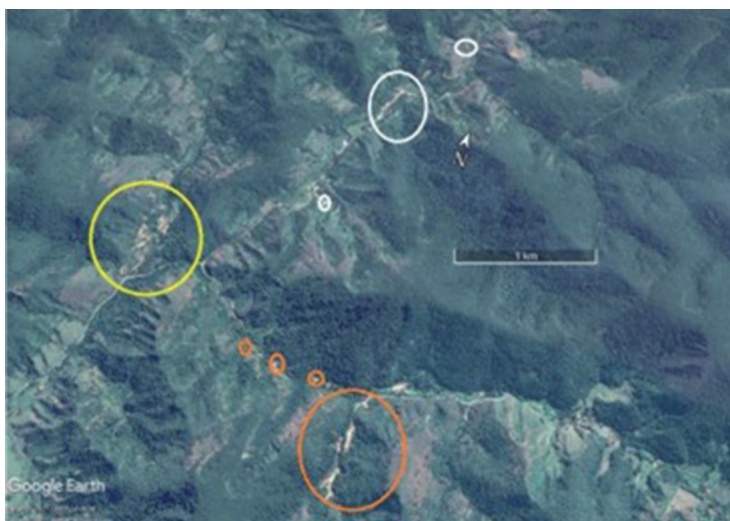
Fig. 5. Imagen de 2012 diferenciando la Aldea Encuentro de las Aguas de las anteriores.