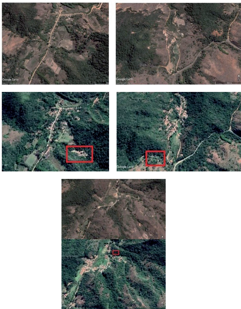
Fig. 7. Ejemplos de la recuperación ecológica de la antigua 'Fazenda Guarani' .

Un informe de la FUNAI de 1979 reconocía que, tras décadas de explotación intensiva de la tierra y de las personas para el cultivo esclavista de café, el lugar se encontraba agotado. Todas las personas del pueblo Pataxó que recordaban los primeros años en la Fazenda coincidían en que la dureza de las condiciones derivaba precisamente de dicho agotamiento ecológico. Las medidas que el pueblo Pataxó ha tomado de manera activa