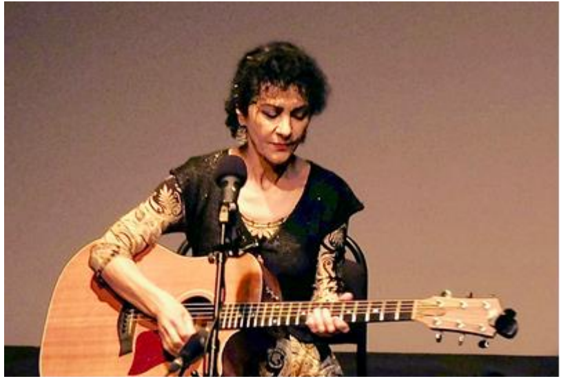
Concert de Ionatu a Marsella (2016).

«Per a mi, grega de la diàspora, la meva veritable pàtria és la meva llengua. En efecte, crec que si la poesia no existís, no m'hauria convertit en músic».