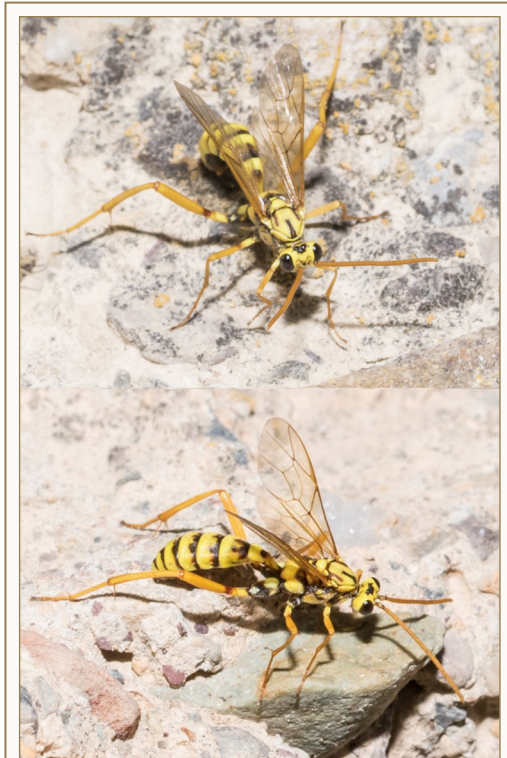
FIGURA 1. Hembra estival de Latibulus orientalis Horstmann, 1987 en Murcia (España), fotografiada mientras inspeccionaba unos nidos de Polistes dominula en unas oquedades de roca.

geolocalizada (Fig. 1A-B), la presencia de L. orientalis en Europa continental. La distribución conocida previamente de esta especie corresponde a la parte más oriental del paleártico occidental, con citas en Chipre e Israel (Horstmann, 1987) y más recientemente en Irán (Zardouei Heydari et al., 2020).