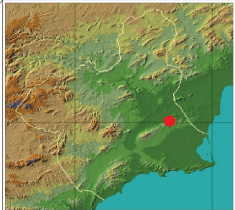
FIGURA 2. Mapa con la nueva localización de Latibulus orientalis Horstmann, 1987 (rojo) y las localizaciones conocidas hasta la fecha (azul). Mapas adaptados de National Geographic y Región de Murcia Digital ( www.regmurcia.com ).

Map with the new record of Latibulus orientalis Horstmann, 1987 (in red) and the previously known records (in blue). Maps adapted from National Geographic and Región de Murcia Digital ( www.regmurcia.com ).