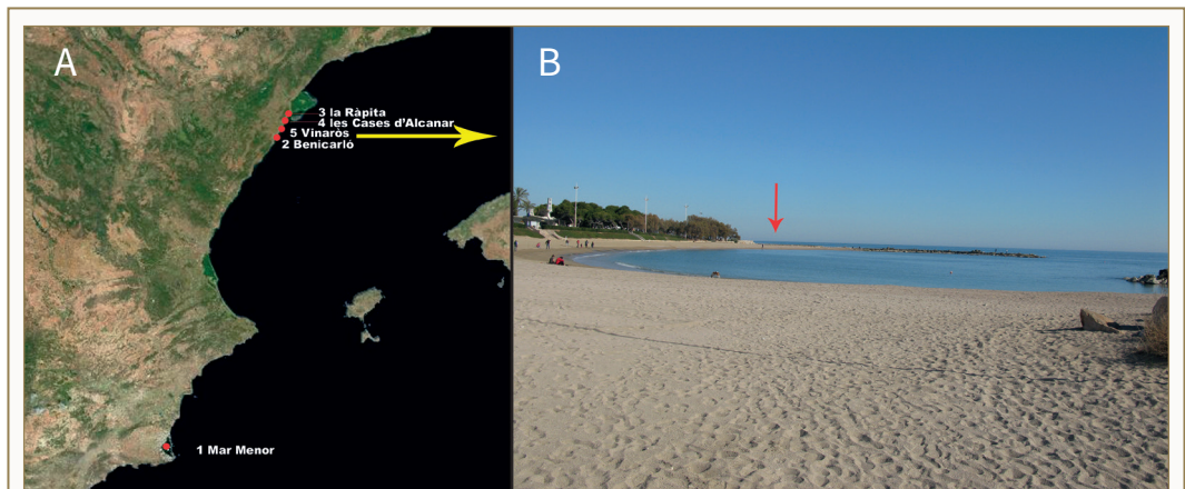
FIGURA 1. A Localització del cinc llocs on s'ha trobat Cerithium scabridum Philippi, 1848 a la costa mediterrània de la península Ibèrica. B Platja del Fortí a Vinaròs (el Baix Maestrat; País Valencià). La fletxa roja indica el lloc concret de la platja on s'ha trobat C. scabridum .