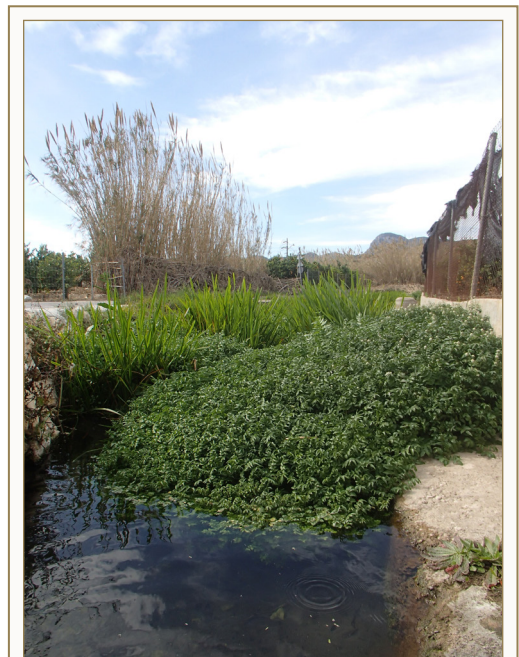
FIGURA 1. Hàbitat on es van trobar els exemplars de Pomacea diffusa Blume, 1957, a prop de Gandia.

Precisament, la nova troballa de P. diffusa sembla que es correspon plenament amb aquesta activitat. Es tracta de l'espècie sovint catalogada com Pomacea bridgesii (Reeve, 1856), un dels invertebrats més àmpliament emprats en aquest sector, tot i que treballs moleculars han evidenciat que l'espècie comercialitzada seria sempre la primera (Cowie et al., 2006; Cowie, 2017). Tot i la prohibició legal de posseir i comercialitzar qualsevol espècie del gènere Pomacea , no sembla que hi hagi un acompliment estricte de la norma, i per tant la possibilitat d'escapaments accidentals o alliberaments intencionats continuen vigents a la nostra geografia.