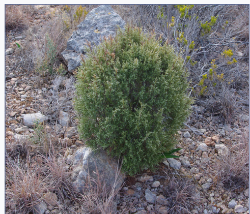
FIGURA 2. Diferents exemplars de Juniperus phoenicea var. forneri presents en la població de Cala Argilaga (Peníscola, Castelló).

Several plants of Juniperus phoenicea var. forneri from Cala Argilaga population (Peníscola, Castelló province).