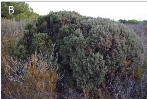
FIGURA 1. A: Aspecte de l'hàbitat litoral on creix Juniperus phoenicea var. forneri , Cala Argilaga (Peníscola, Castelló); B: exemplar d'aquesta varietat dins de la població castellonenca.

A: Habitat of Juniperus phoenicea var. forneri , Cala Argilaga (Peníscola, Castelló province, Spain); B: specimen of this variety from this population of Castelló province.