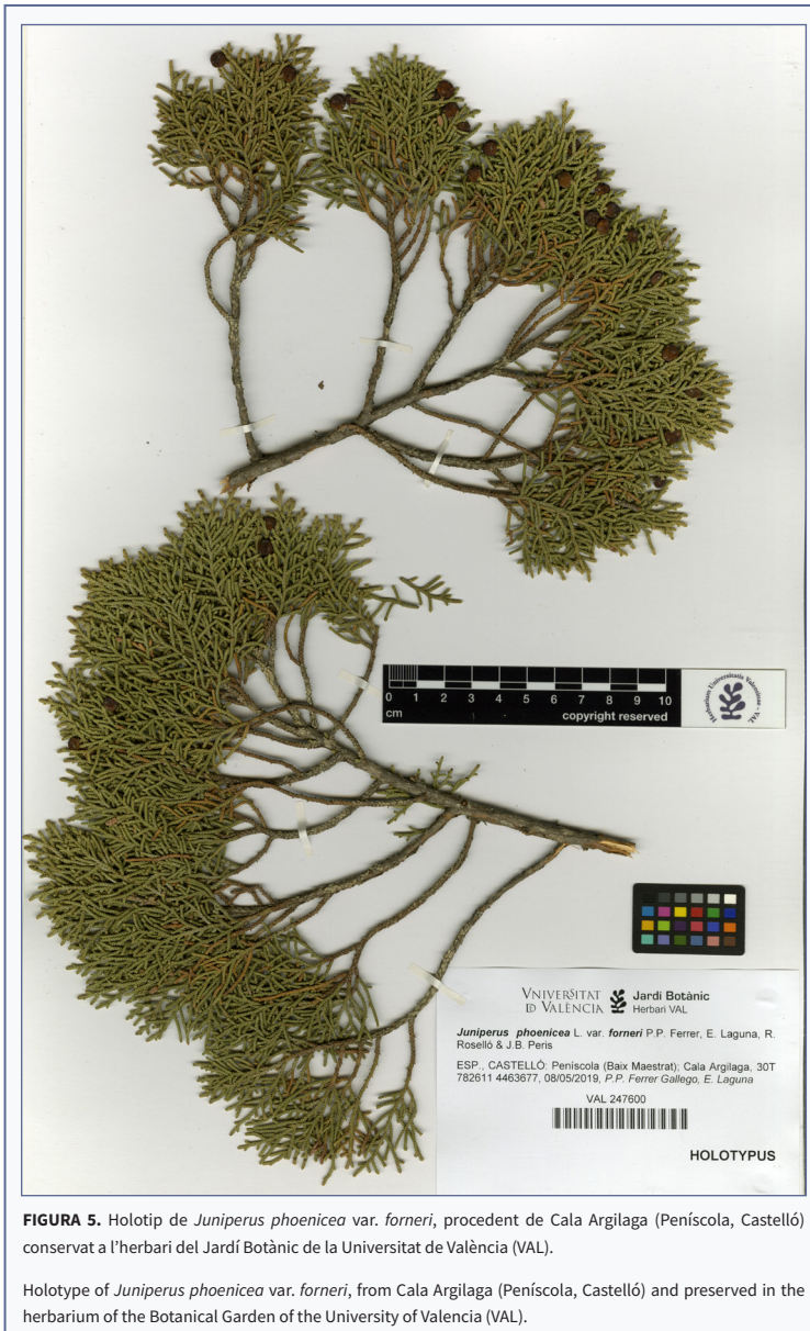
FIGURA 5. Holotip de Juniperus phoenicea var. forneri , procedent de Cala Argilaga (Peníscola, Castelló) conservat a l'herbari del Jardí Botànic de la Universitat de València (VAL).

Holotypus: Hs. Castelló, Peníscola (el Baix Maestrat), Cala Argilaga, 30T 782611 / 4463677, 8-V-2019, P. Pablo Ferrer-Gallego & E. Laguna, VAL 247600 (Fig. 5). Isotypus: VAL 247601. Paratypus: Tarragona, Siurana, voltants