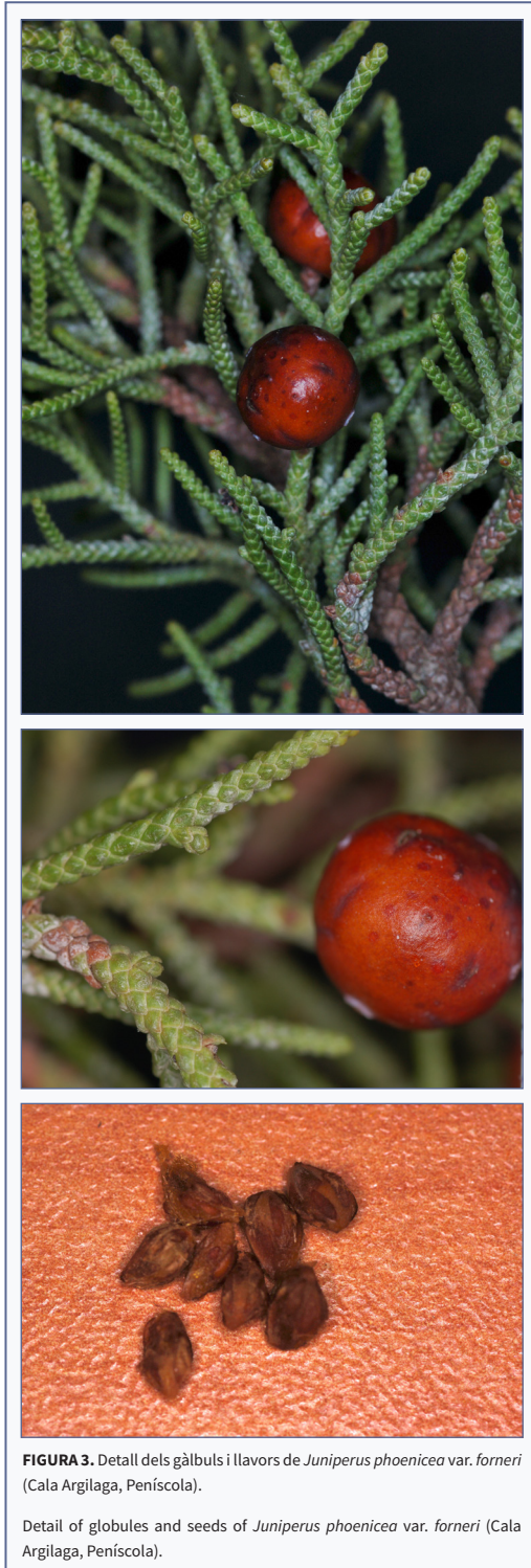
FIGURA 3. Detall dels gàlbuls i llavors de Juniperus phoenicea var. forneri (Cala Argilaga, Peníscola).

Detail of globules and seeds of Juniperus phoenicea var. forneri (Cala Argilaga, Peníscola).