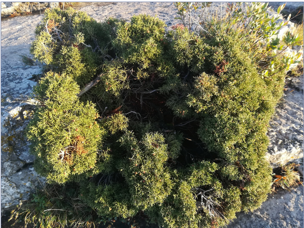
FIGURA 4. Exemplar de Juniperus phoenicea var. forneri (Siurana, Tarragona).

Diagnosi. A Juniperus phoenicea sensu stricto habito saepe globulatis densissimum et minoris. Foliis minoris 1-1,2 × 0,9-1 mm longis. Strobilis minoribus 6-8 mm longis. Galbulis minoris (5) 6-8 mm longis. Seminibus 3-4 × 2-3 mm saepe minoris differt.