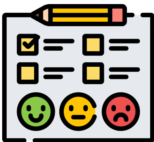
Figura 1. L'avaluació és important en qualsevol procés d'E-A.

Tot sovint, en la nostra quotidianitat , acostumem a rebre sol·licituds d'avaluació . Per exemple, quan descarreguem una aplicació mòbil se'ns sol·licita que la valorem, quan participem a un curs formatiu se'ns proposa que donem la nostra opinió al respecte i, fins i tot, quan visitem algun restaurant tenim l'oportunitat de valorar la nostra experiència en aquest.