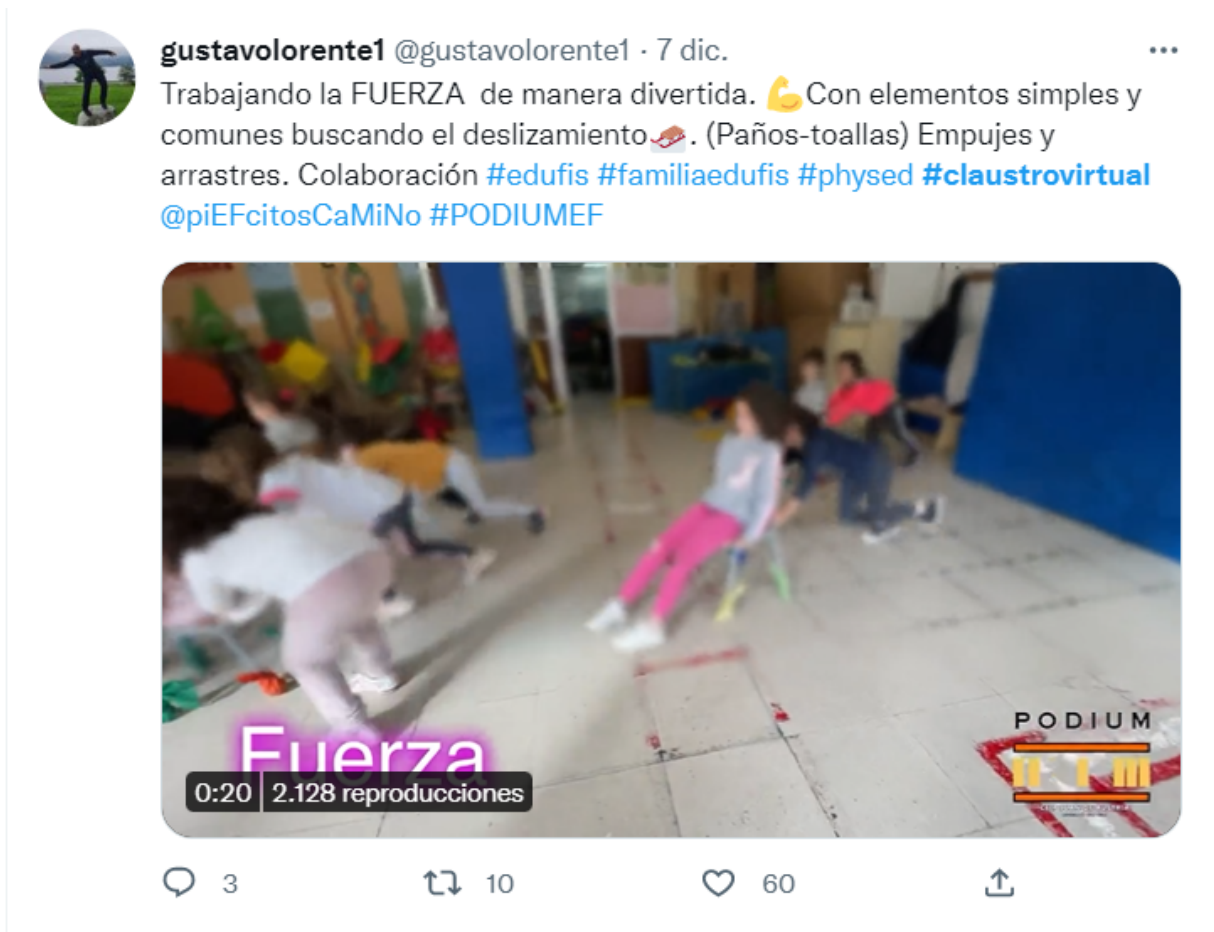
Figura 5. Exemple de proposta educativa compartida a Twitter. Font: Lorente (2022).