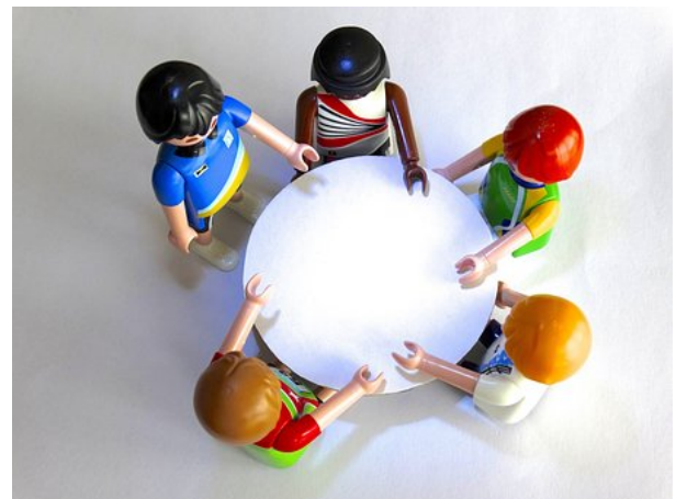
Figura 2. Representació de pràctiques d'aprenentatge compartides.

L'objectiu de la revisió entre iguals és promoure el desenvolupament professional, la col·laboració, l'autoavaluació i la coavaluació des d'una relació horitzontal (Wilkins i Shin, 2011). Per la seua part, les comunitats de pràctica s'entenen com col·lectius que comparteixen una preocupació sobre una o més qüestions i que aprofundeixen en el seu coneixement i expertia de manera interactiva i continuada en el temps (Wenger et al., 2002).