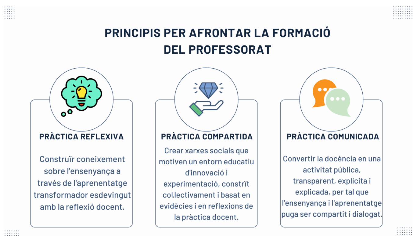
Figura 1. Principis de la formació docent.

Com ja hem dit, la formació és un element del desenvolupament professional essencial i pot materialitzar-se de diferents maneres. Així doncs, hem de seguir els següents principis per afrontar una formació docent enriquidora i completa (Fernández March, 2020):