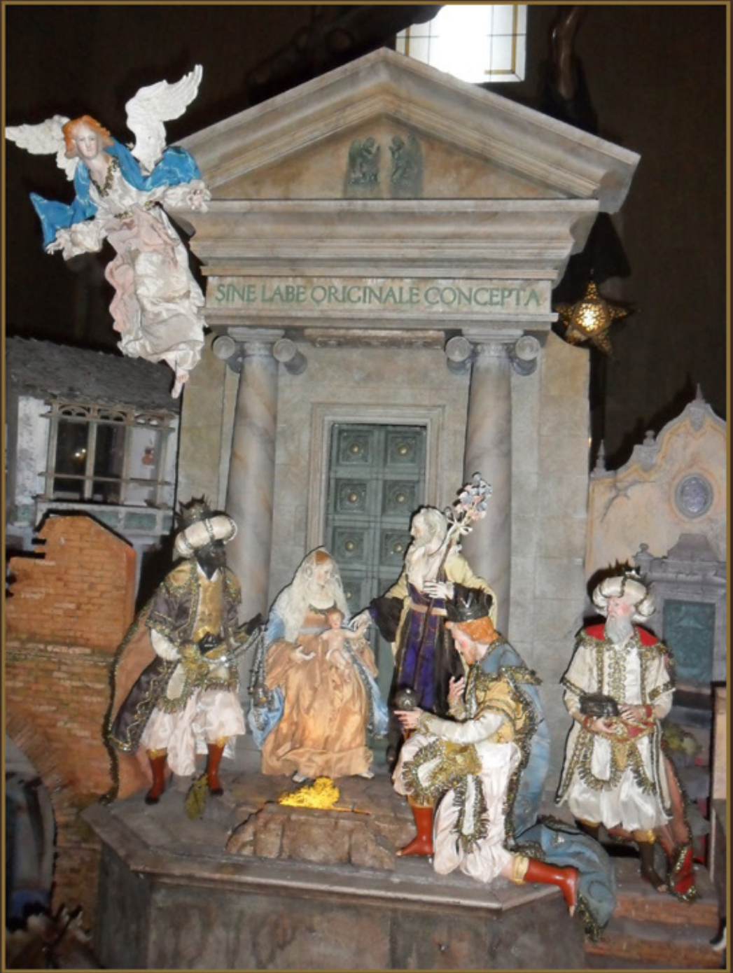
Belén napolitano de la Basílica de San Pascual