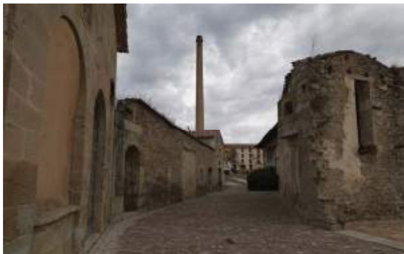
Figura 3. La Fábrica Giner, en Morella, fue un importante núcleo industrial.

Las obras del complejo se prolongaron entre 1870 y 1876, instalándose entonces la máquina de vapor, las calderas y una primera chimenea –la que persiste en la actualidad data de 1885-, inversiones con las que se alcanzó el máximo productivo hacia finales de siglo –en 1896 había 170 trabajadores censados-, teniendo en cuenta que también se elaboraban tejidos en domicilios particulares –hasta 300 personas adicionales llegaron a trabajar en telares en masías y pueblos vecinos-, algo típico en la industrialización textil.