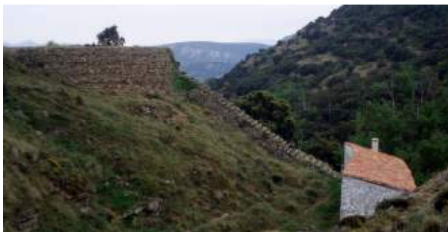
Figura 1. El barranco dels Molins, en Ares (Castellón), es una buena muestra de la protección patrimonial de los molinos porque es Bien de Interés Cultural.

Como signo de la preindustrialización también se observa un fenómeno harto frecuente, la diversificada producción de los molinos que, si tienen agua suficiente, son capaces de moler cereal durante el día, producir luz por las noches y mantener alguna otra actividad complementaria como cortar madera, moler minerales como el yeso u otros, triturar ropa, etc. Esto es posible sobre todo en aquellos ingenios alimentados por ríos más caudalosos o en su caso por acequias importantes, es decir, las instalaciones que hasta pueden prescindir de balsa porque no necesitan almacenar agua. Es la siguiente fase del proceso evolutivo, la aparición de los molinos-fábrica o molinos multifunción que provocan una incipiente industrialización de la montaña o, para ser más exactos, un proceso preindustrializador que no siempre encuentra continuación temporal posterior capaz de afianzar un tejido industrial.