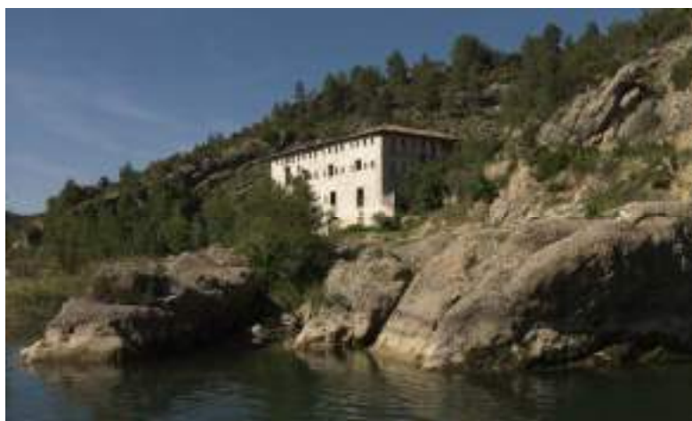
Figura 4. La Fábrica, en Sorita, está en grave riesgo de derrumbe (Imagen de Pascual Mercé).

La creación de rutas culturales o itinerarios del patrimonio sería otra singular apuesta para convertir estos recursos en productos –una de las formas de garantizar su preservación–, aunque para ello haría falta señalar senderos y áreas, crear paneles informativos e incluso diseñar exposiciones o museos al aire libre, con visitas al interior de los edificios más notables para propiciar su demanda como componente del mundo turístico, educativo y cultural. Esta labor, además de hacer más visible el patrimonio, debería ir acompañada de acciones de restauración y/o consolidación de las fábricas de río que todavía pueden salvarse para un posterior aprovechamiento cultural o recreativo.