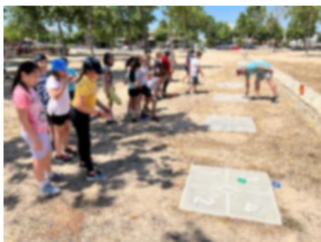
“7 i mig”