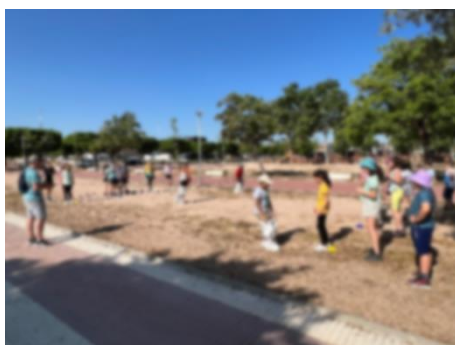
Cursa de sacs