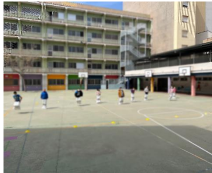
“Cursa de sacs”