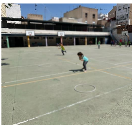
“Boli dali golf”