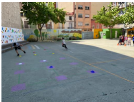
“Tres en ratlla motriu”