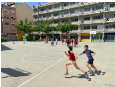
“Policies i lladres”