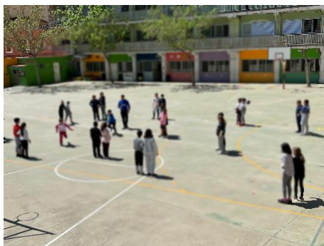
“Les àmfores mixtes”