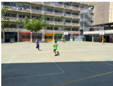
“Amagatall 2 equips” (variant)