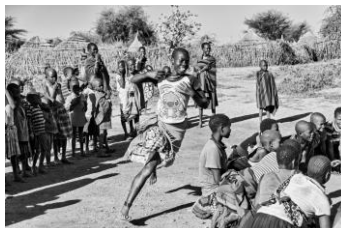
Figura 1. Flying, de Rod Waddington