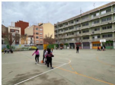
"Els 4 cantons"