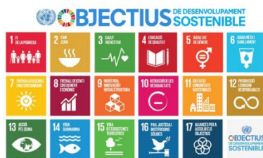
Figura 2. Objectius de desenvolupament sostenible