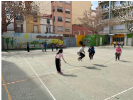
“Saltar a la corda”