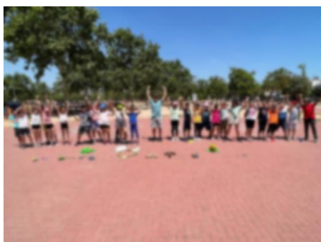
Anar caminant des del Parc de Jocs Tradicionals de Castelló a l'escola.