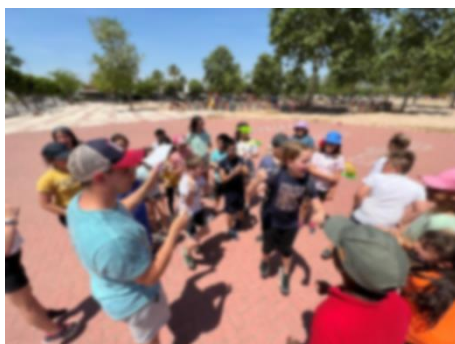
Discurs d'agraïment a l'alumnat en forma de cloenda.