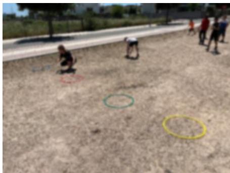
“Boli dali golf”