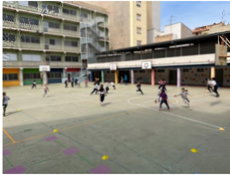
“Lladre de cues”