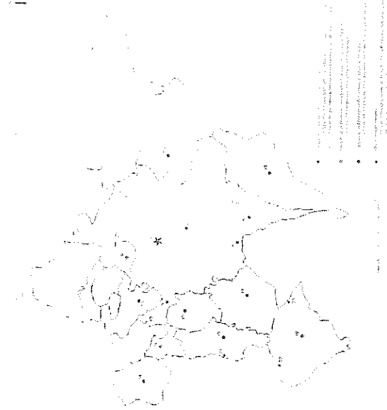
Figura 1. Entidades poblacionales del término de Morella.

Viciana, M. (1972). Crònica de la inclita y coronada ciutat de València y de su reino . Edició facsímil de la Universitat de València. 4 volumenes.