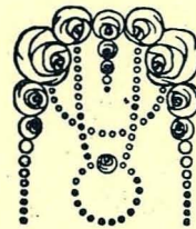
CARRER SANT BLAI. CASTELLÓ

Acta del "Llibre de Capitols" en la qual consta que el 2 de febrer de 1717, reunits els capellans en l'Aula Capitularda de l'Església Major de Santa Maria, acordaren proclamar Sant Blai, com a patró de Castelló.