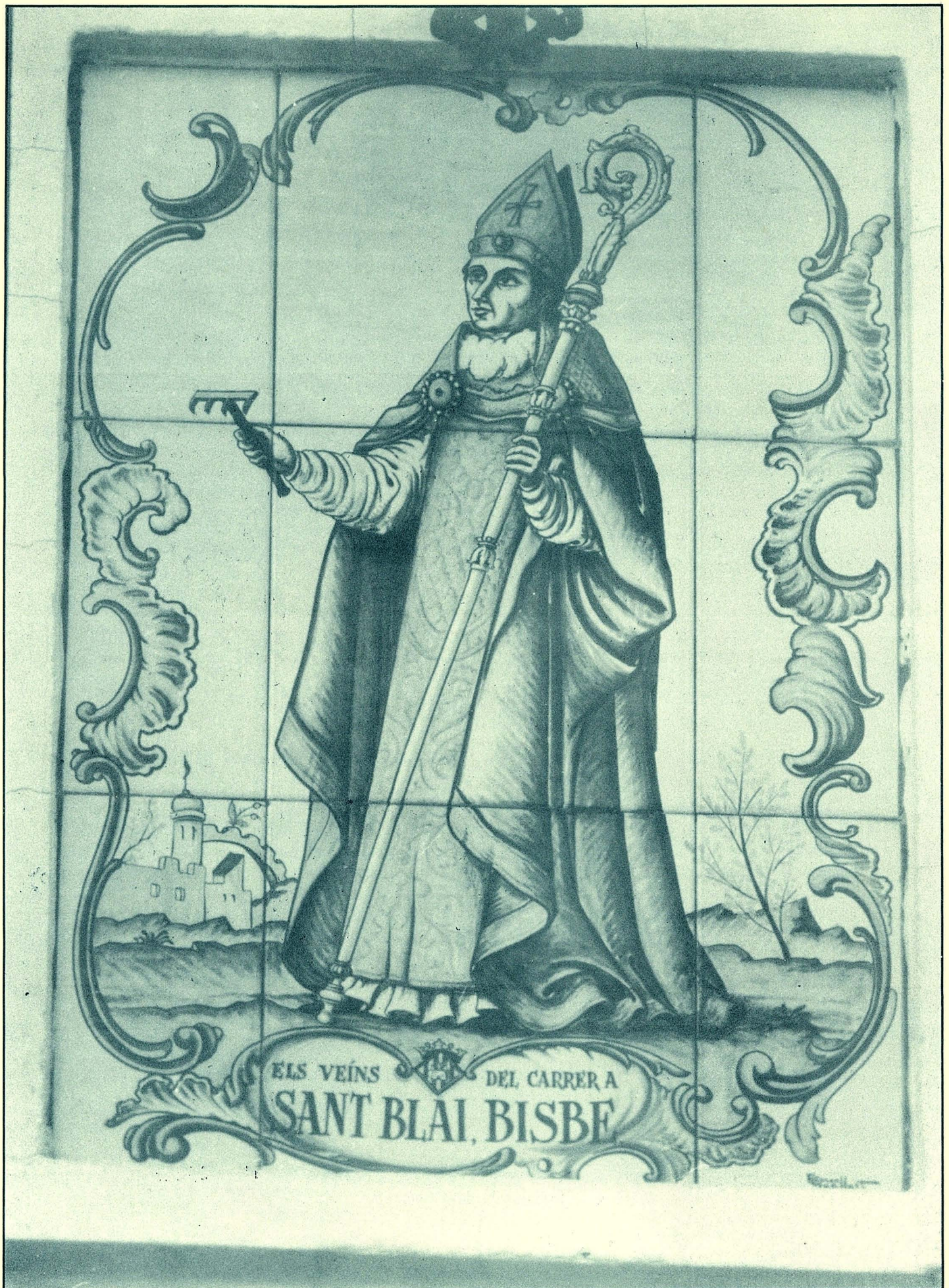
Retaule ceràmic de Sant Blai