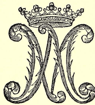
Ntra Sra de Bonany

Puix que Petra talaiau com a Mare i Protectora, donau-nos bon any, Senyora, bon esplet d'amor i pau.