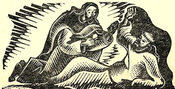
Xilografia d'A. Getalbert