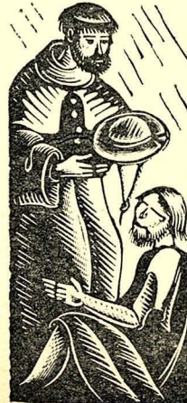
Electa de Mossèn Josep Serra Janer, prev.