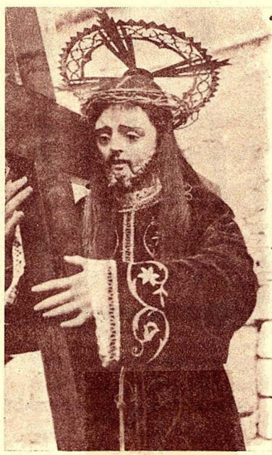
Antiga imatge destruïda l'any 1936.

Des de la fundació, la Germandat participà a la Processó del Divendres Sant amb el "misteri del Natzarè", integrat per una sola figura, gairebé de tamany natural, la qual representava Jesús amb la creu al coll; la imatge era del segle XVII i es guardava al Convent dels Franciscans, junt a l'església, a la Rambla Vella, fins l'any 1835 que per l'exclusió de les ordres religioses restà en mans particulars fins que fou reintegrada a l'Església de Sant Francesc. L'any 1868 es traslladà dita imatge a l'Església de Natzaret, on es guardaven els altres "passos" i imatges de Setmana Santa, i cada any els natzarens la recollien per col·locar-la al pas del seu propi nom.