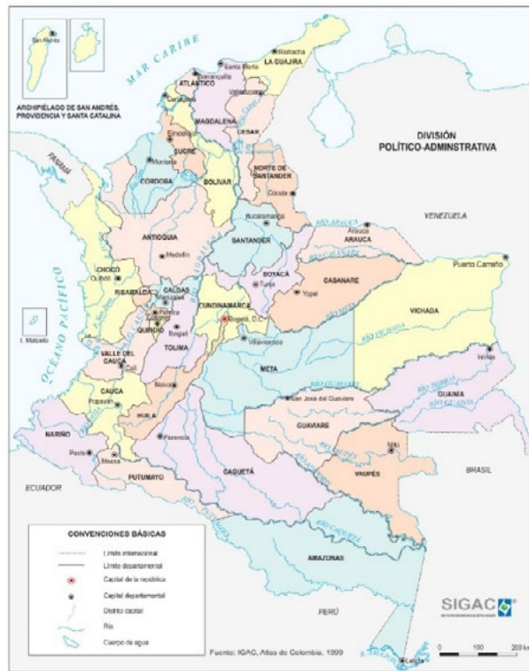
Figura 2. Mapa político de Colombia.