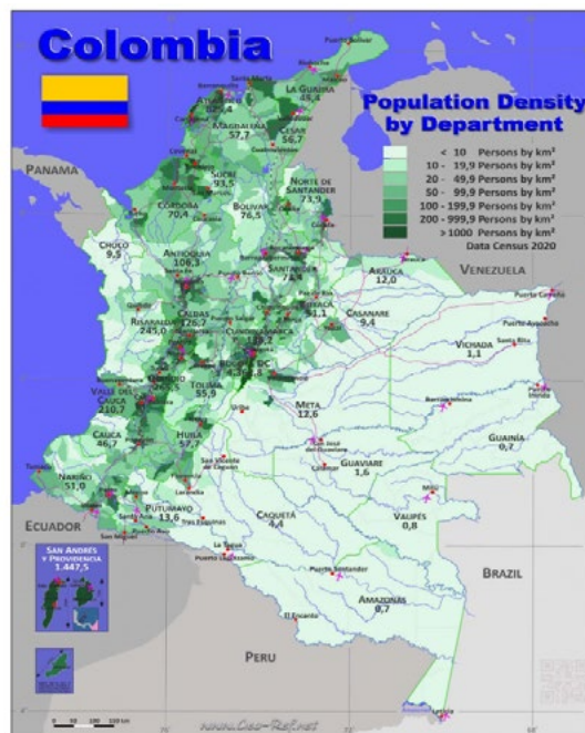
Figura 3. Densidad de Población.