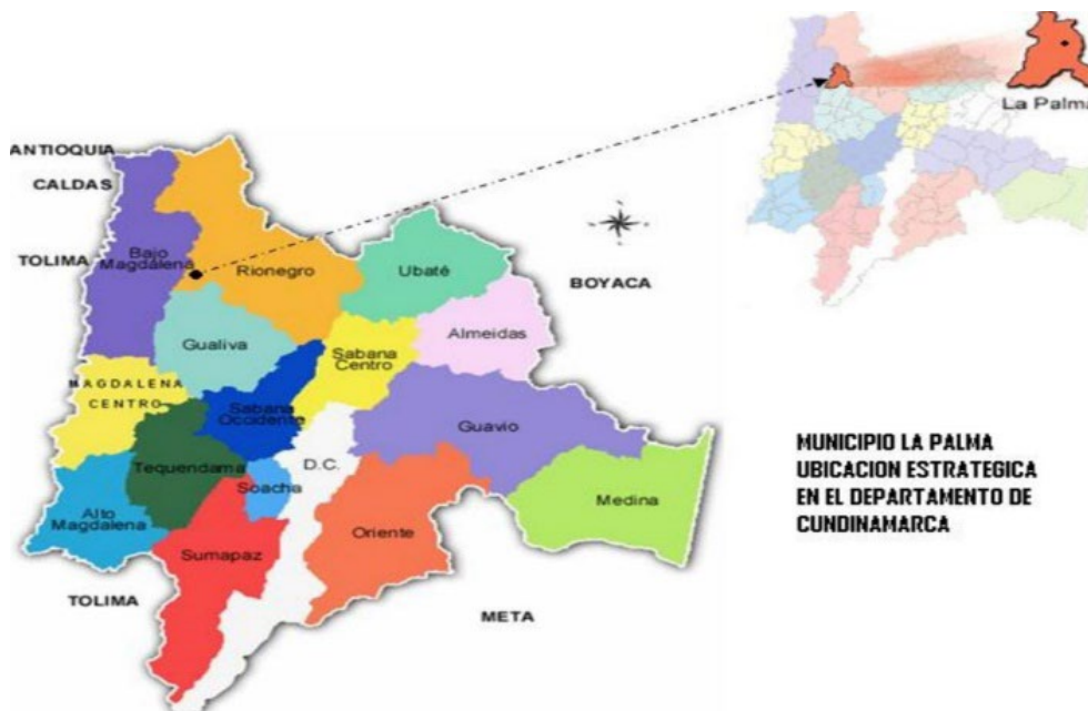
Figura 4. Mapa político de Cundinamarca. Retomado de: http://www.lapalma-cundinamarca.gov.co/municipio/nuestro-municipio .

[...] un punto estratégico de la geografía colombiana, debido a que esta zona se convirtió en un territorio propicio para la instalación de la guerra a consecuencia del derrumbe parcial del estado, las dificultades en el acceso terrestre desde la capital del país, la cercanía al poliducto Puerto Salgar-Mancilla y las rutas de salida hacia otros departamentos posibilitando la movilidad de las diferentes fuerzas en disputa, factores que propiciaron que grupos armados como las FARC-EP, los Paramilitares y el Ejército Nacional convirtieran el territorio en un centro de acciones de violencia sistemática. (Fajardo, Liberato y Rodríguez, 2021, 197)