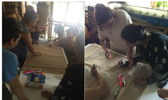
Figura 5. Sistematización a través de la cartografía social.

[...] un lenguaje de representación del espacio geográfico, una forma de abstracción de la realidad; este lenguaje se transmite a través de una forma particular de comunicación iconográfica, el mapa, lo que nos lleva a situarlo dentro de un proceso comunicativo; así como en el discurso hablado prima la voz de la palabra, en el mapa priman las imágenes, los signos y los símbolos se realiza una evaluación del estado actual de estos espacios comunitarios. (Barragán, 2019, p. 142)