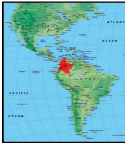
Figura 1. Mapa Político de América y ubicación de Colombia

Colombia se ubica en el extremo noroccidental de América del Sur, con una superficie de 1.141.748 Km 2 , tiene costas en el Pacífico y en el Atlántico. Atravesada de Sur a Norte por los Andes que, cerca de la frontera meridional se dividen en tres ramales: cordilleras Occidental, Central y Oriental. Al Este de la cordillera Oriental se encuentra la Orinoquía o los Llanos, y la Amazonía colombiana. Aparte de los Andes: Serranía del Baudó y Sierra Nevada de Santa Marta. (2)