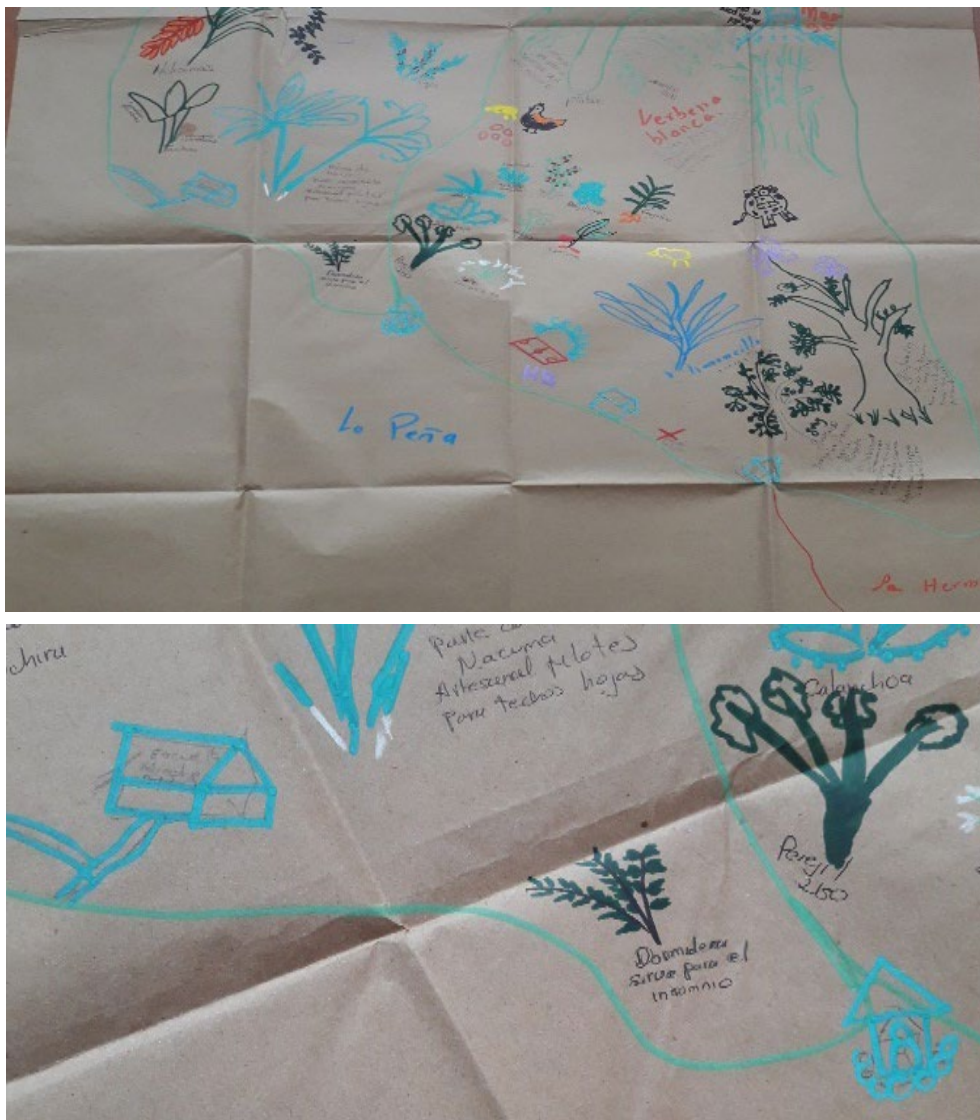
Figura 6. Cartografía social. Lugares recuperados en color verde.

Cabe exaltar en este punto, la capacidad de agenciamiento de las mujeres campesinas de las veredas Hinche Alto e Hinche Bajo, quienes, a partir de su deseo de forjar paz en el territorio, regresaron al mismo sin respaldo estatal y existiendo aún presencia de las diferentes fuerzas armadas en disputa, progresivamente, se involucraron en procesos de capacitación y gestión que han permitido ir transformando los espacios comunes: